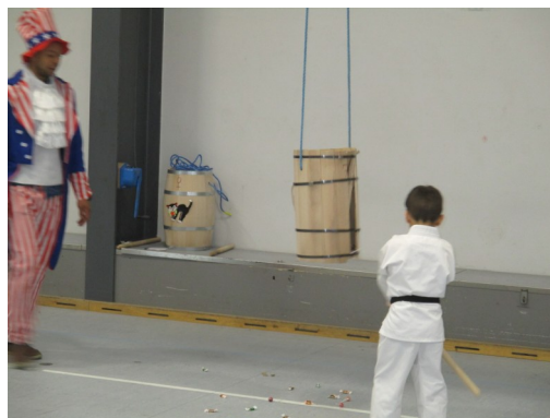
Hvor skal jeg slå?