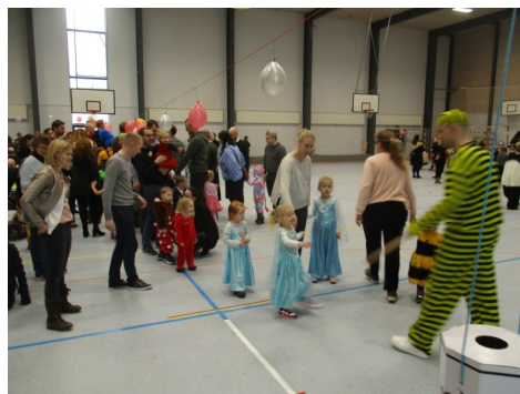
Hvorfor er køen så lang!!