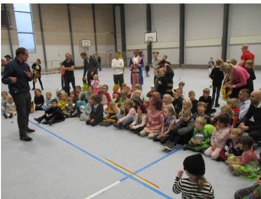
Stort fremmøde Trods vinterferie!