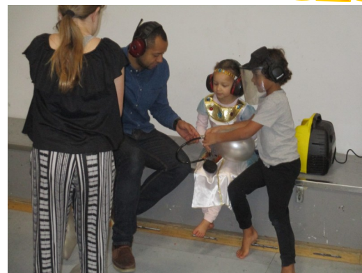
Oppustning af balloner Og jeg gir' den hele armen