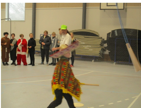
Bare en på kassen