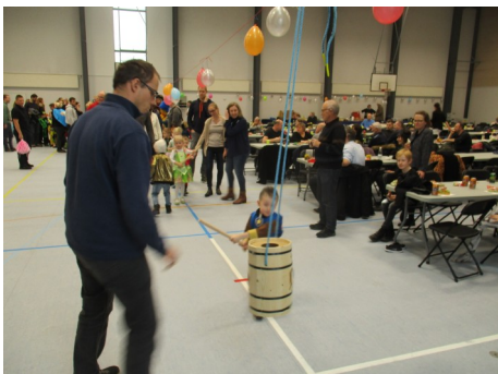
Hvornår er det min tur?