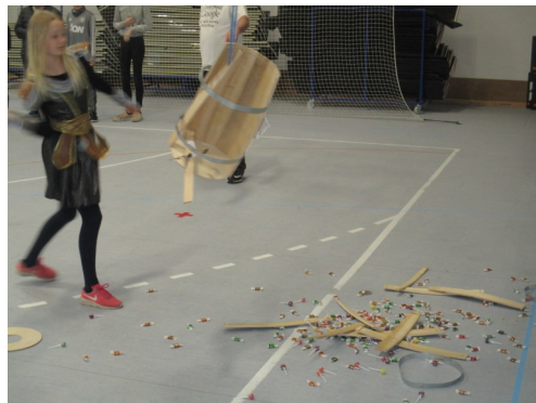
Sådan een på goddagen