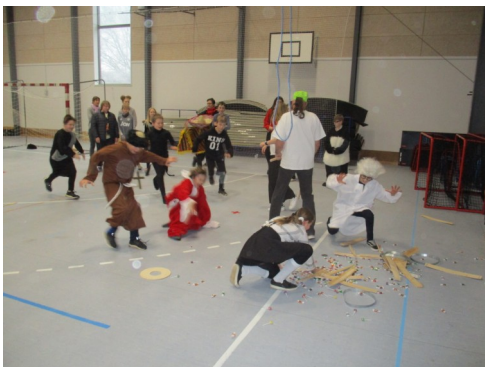
Hvad har jeg vundet??