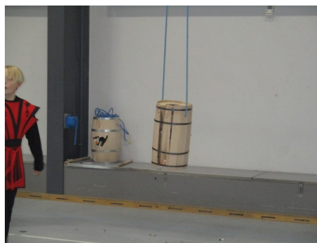
Kan jeg ikke få noget hjælp.