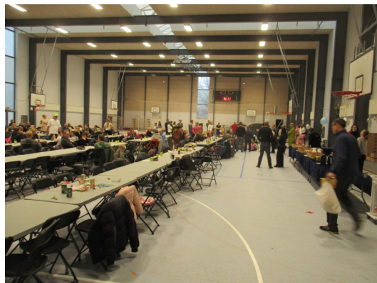
Tak for denne gang.... Vi ses til næste år.