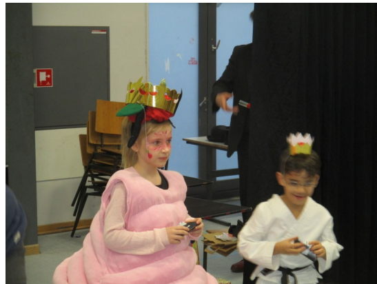
We are the champs!!!