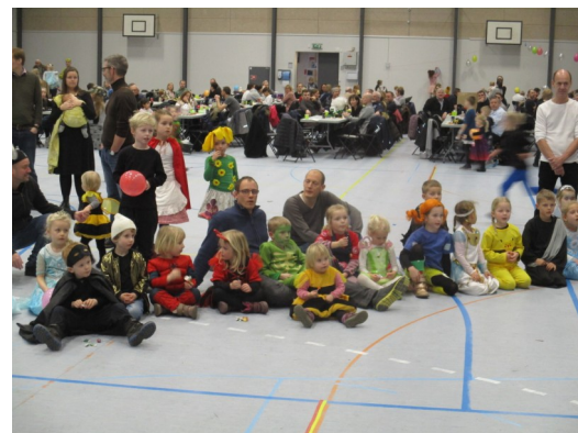
Vi kan bare det der!!!!