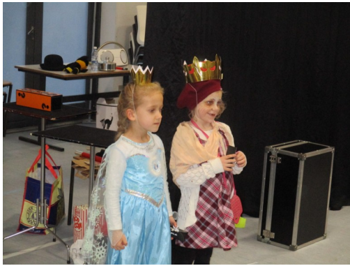
Kronen på værket