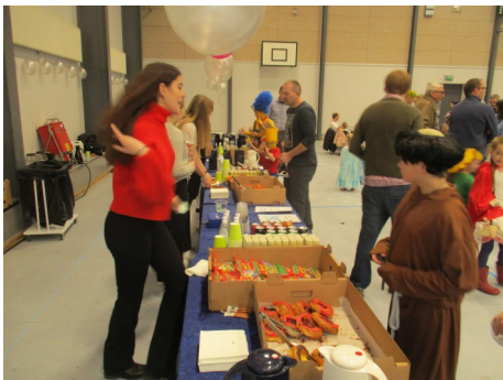
Så er det spisetid