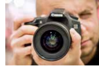
Der Fotograf sollte unbedingt dabei sein.

Die Hochzeitspapeterie ist richtungsweisend für die Gestaltung der Feier. Die Save-the-Date-Karte, mit der die Verlobung offiziell bekanntgegeben wird, die offizielle Einladungskarte und die Danksagung nach dem großen Tag – diese drei rahmen die Hochzeit ein und spiegeln den Stil der ganzen Feier wieder. Die Gestaltung der Hochzeitspapeterie gibt den Gästen schon mal einen kleinen Vorgeschmack darauf, wie die Hochzeitsfeier aussehen wird. Beispielsweise bieten sich für eine Strandhochzeit mit Muscheln und Wellenmotiven verzierte Karten im maritimen Look an. Viele Paare entscheiden sich zudem dafür, auch Tischkarten, Menükarten und Kirchenheften ein einheitliches Aussehen zu geben.