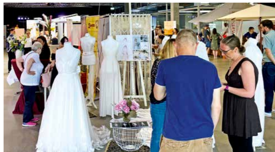
Ein großes Bedürfnis an Information haben die Besucher auf der Messe „Hochzeitsfieber“.

die Brautmodenschauen, bei denen aber nicht nur eine Auswahl der schönsten Brautkleider gezeigt werden, sondern auch Mode für den Bräutigam. Zwei Mal werden am Messtag die Models auf dem Laufsteg zu sehen sein. Die erste Schau beginnt um 11.30 Uhr und die zweite um 13.30 Uhr. „Hochzeitsfieber“ ist damit kreisweit die einzige Messe, die