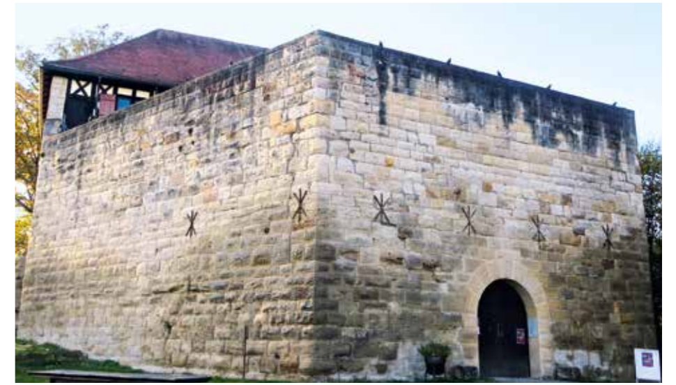
Eine Mauer mit dicken Buckelquadern umschließt Burg Wäscherschloss.

Im Laufe der Geschichte wechselte die Burg mehrfach Besitzer und Funktion. So war im Gemäuer auch der Amtssitz eines Vogtes. 1484 wurde die