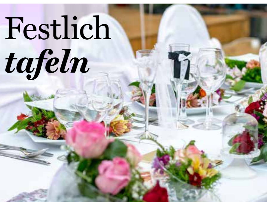
Der gedeckte Tisch ist bei einem Fest ebenso wichtig wie ein gutes Essen.

Frikadellen müssen nicht immer in der Pfanne gebraten werden. Man kann die herzhaften Fleischbällchen auch im Backofen zubereiten. Dann können von den sonst so fettigen Leckerbissen auch ruhig ein paar mehr vertilgt werden. Die rohen Frikadellen einfach auf ein mit Backpapier ausgelegtes Blech legen und bei rund 220 Grad ungefähr fünfzehn Minuten backen.