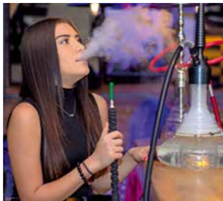
Die Shisha findet immer mehr Freunde.

Der 25-Jährige mit türkisch-arabischen Wurzeln ist noch im Studium als Maschinenbau-Ingenieur. In einer Freizeit tourt er mit seinem Equipment zu Hochzeiten, Betriebsfeiern, Geburtstagen, oder Junggesellenabschieden, sein Outfit ist stets angepasst. „Zu Hochzeiten komme ich selbstverständlich elegant im Anzug“, lacht er. Es gebe viele Fans, die sich mit dem Thema aus-