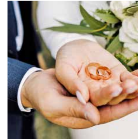
An die Trauringe rechtzeitig denken.

Gerade wenn alle am meisten Spaß haben, sollten noch professionelle Fotos gemacht werden. Ein guter Hochzeitsfotograf unterbricht die Feiern nicht für gestellte Bilder, sondern fängt echte Momente ein und hält die Stimmung fotografisch fest. Nichts ist ärgerlicher, wenn nach dem schönsten Tag im Leben nur Fotos vorhanden sind, die über- oder unterbelichtet sind, auf denen die Gäste die Augen zu haben oder unbewusst Grimassen schneiden oder auf denen die wichtigsten Momente des Festes fehlen. Also: am professionellen Hochzeitsfotografen nicht sparen.