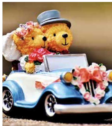
Wenn geheiratet wird, entscheiden die Brautleute auch über den Familiennamen

Preisgekrönter Fotograf Martin Hecht aus Göppingen zählt zu den besten Hochzeitsfotografen Deutschlands. Das sieht zumindest die „Wedding Photographer Society“ so, die ihn unter den 100 Besten gleich mal auf den ersten Platz setzte. Der gebürtige Karlsruher, in Geislingen ausgewachsen, kann seine Fotoarbeiten mit zahlreichen Preisen belegen. 2020 gewann er den Award Fearless Photographers, den für ihn bislang wichtigsten.