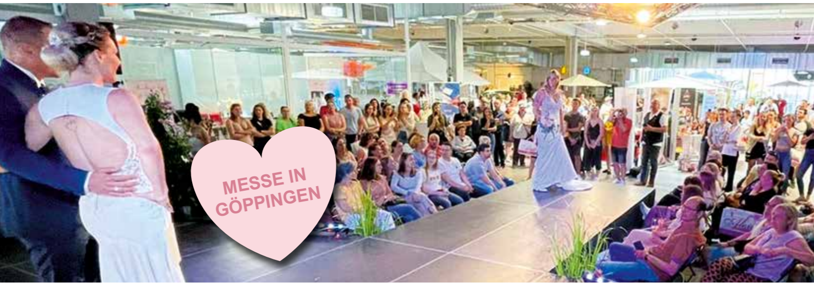
Publikumsträchtigt sind die Brautmodenschauen auf der Messe „Hochzeitsfieber“, die am 26. März wieder in Göppingen stattfindet.