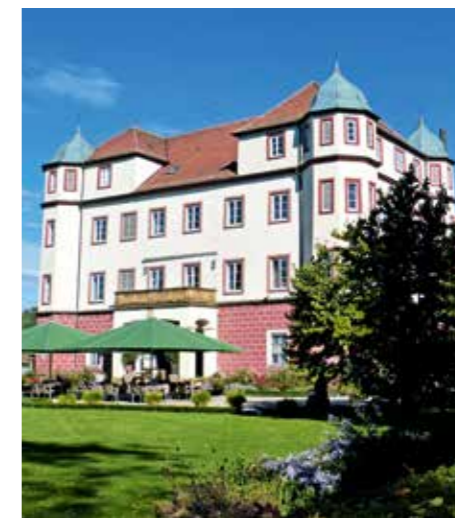
Schlösser mit Standesamt gibt es in Rechberghausen (oben) und Donzdorf.

Paare können sich auf Burg Wäscherschloss standesamtlich oder frei trauen lassen und die Burg als Location für ihre Hochzeitsfeier mieten. Das Team der Burgverwaltung berät Verliebte gerne und unterstützt bei den Hochzeitsplanungen. Standesamtliche Trauungen sind auf Burg Wäscherschloss von Mai bis Oktober von Montag bis Freitag möglich. Für standesamtliche Trauungen steht der Große Saal im oberen Geschoss der Burg zur Verfügung – mit fantastischer Aussicht auf den Hohenstaufen und das Stauferland. Der Raum bietet Platz für bis zu 55 Personen. Auf Wunsch können Paare auch den Innenhof für einen Sektempfang nutzen – und vor mittelalterlicher Kulisse mit ihren Gästen auf den „schönsten Tag im Leben“ anstoßen. Auch freie Trauungen sind, umgeben von Natur auf der schönen Wiese vor der Burg, möglich. Zusätzlich stehen der Große Saal oder der Innenhof zur Verfügung. Freie Trauungen sind von Mai bis Oktober an allen Wochentagen auf Anfrage möglich.