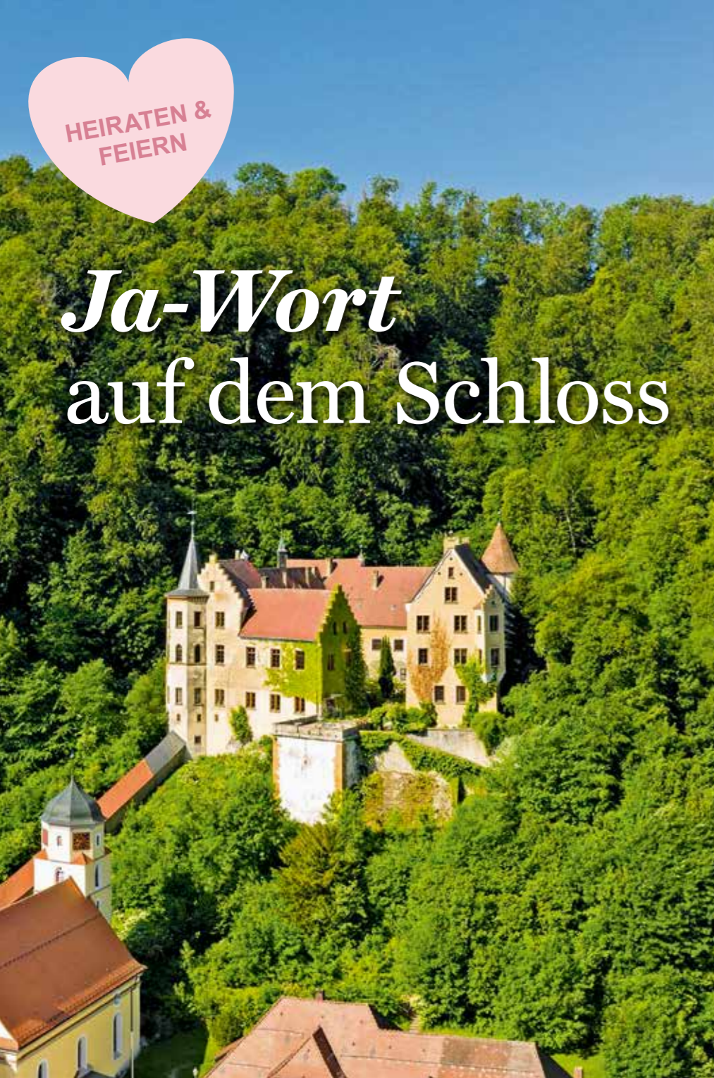
Blick auf Schloss Weißenstein vom „Löwenpfad Heldenbergtour“ aus.

Im Hochzeits-Landkreis Göppingen gibt es viele Orte abseits von Standesamt und Traualtar, an denen Verliebte sich ihr Ja-Wort geben können. Zum Beispiel auf einem Schloss.