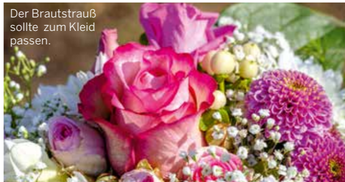
Der Brautstrauß sollte zum Kleid passen.