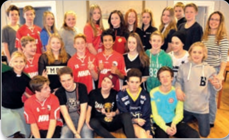
Konfagänget junigruppen 2014/15.