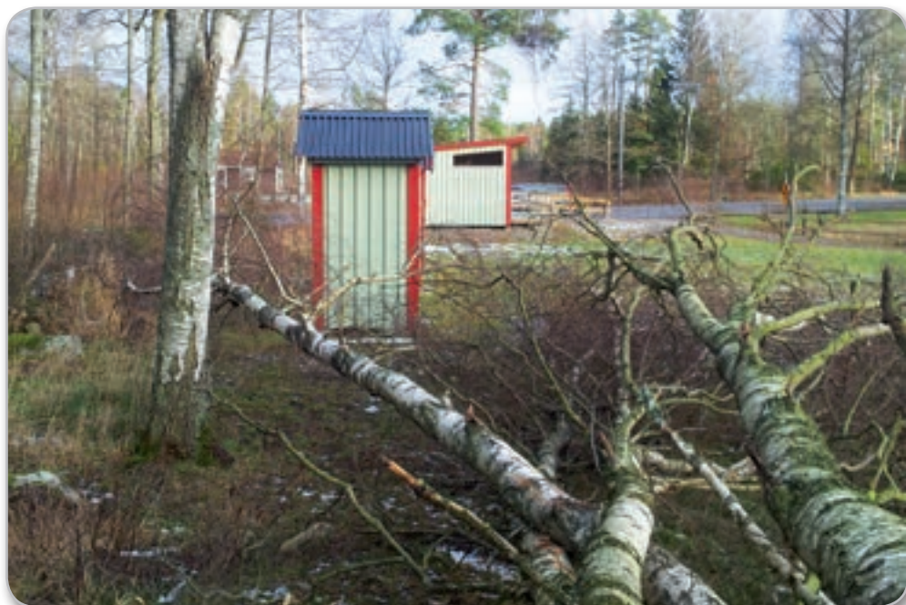
Stormen Egons härjningar vid Losbadet...