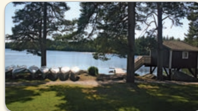
Kanoter finns att hyra för en härlig tur på sjön.

www.hjortsbergagarden.se info@hjortsbergagarden.se 0472 - 55 01 36 eller 073 - 963 39 61 Adress: Gravanäsvägen 19, 342 93 Hjortsberga