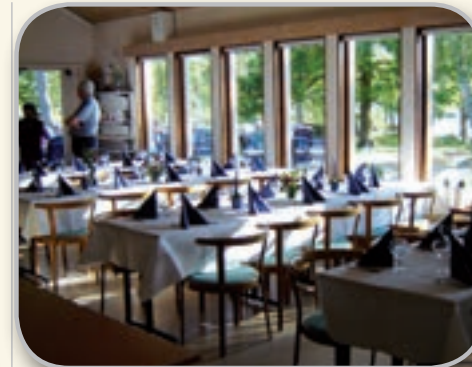
Dukat till fest i stora matsalen.

GÅRDEN HAR TIDIGARE ägts av regionen och södra distriktet inom samfundet Svenska Missionskyrkan, numera Ekuumeniakyrkan. Sedan oktober 2013 ägs den av en ideell förening bildad av de fem Ekuumeniaför-samlingarna i Alvesta, Lammhult, Moheda, Växjö och Åseda.