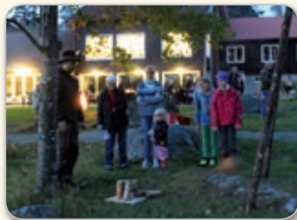
Vildmarksdag för alla åldrar med många olika och roliga aktiviteter.

terna" utgörs av bl a konfirmandläger, blåsarläger, barnkörläger, församlingsläger, vildmarksdagar, scoutverksamhet, lek, bad, studiecirklar, valborgsfirande, retreat, gudstjänster, stilla samtal