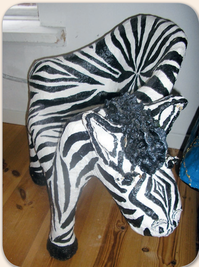
"Slä dig ner", sa zebbran.

Under en resa hamnade jag i Israel, ett helt obekant land där nyårsafton låg på hösten, bokstäverna var märkliga krumelurer och så läste man från andra hållet. Vad skulle hända om man bara