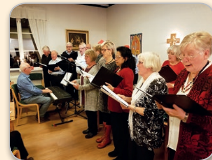
... och tillika självklare körledare vid kvällens kör- och allsång.

Text: Margareta Arvidsson