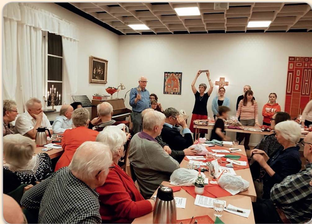
Missionsauktionen hade ett 70-tal gäster som tillsammans drog in nästan 28 000 kronor.

Det blev ett fantastiskt resultat vid årets missionsauktion – drygt 27 700 kronor. I denna summa finns med det som Tisdagsgemenskapen samlat vid sina träffar.