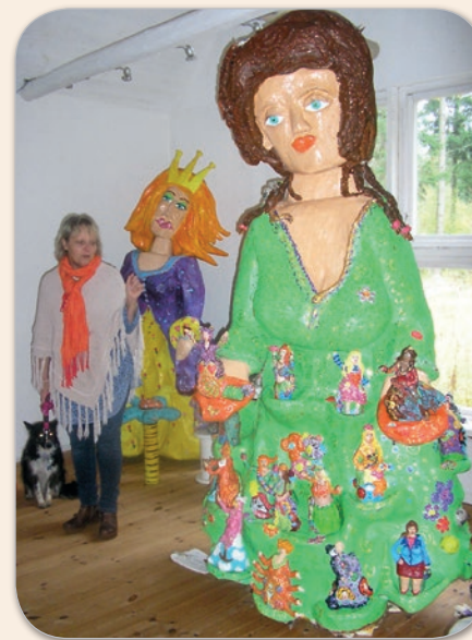
"Välkommen in i min sagovärld!"

Kreativitet är inne, vi måste alla vare sig vi vill det eller inte, tänka utanför boxen då vi står inför en tid av stora förändringar med både enorma utmaningar men också fantastiska möjligheter. Jag sätter min tro till att det kommer något gott ur det som sker även om det emellanåt verkar omöjligt. Alla kan göra något även om det verkar ynka