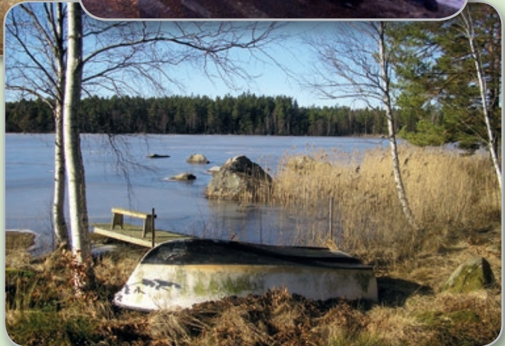
... och utsikt från strandpromenaden 2...