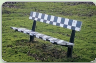
Sätt dig en stund och njut i solen!