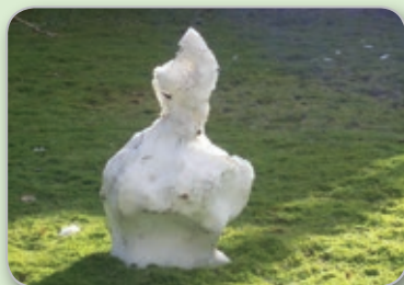
Gubben blir bara magrare och magrare.