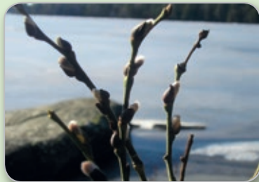
Sov ej längre videung, nu när det är vår!