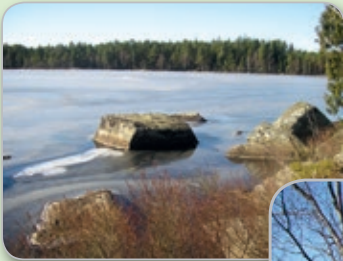
Utsikt från strandpromenaden 1...