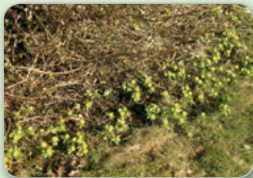
Vintergäck på Åvägen