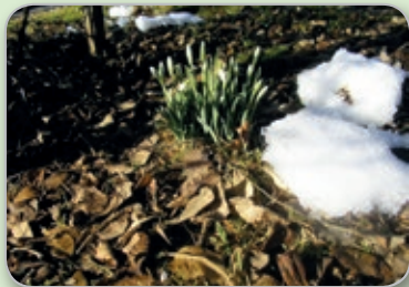
Snödroppsknoppar på Åredavägen

Vintergatan lämnar spåren av ett solsystem på våren. Tussilagosolar strålar likt små mynt av guld som prälar.