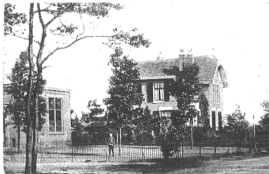
De eerste school in deze gemeenschap aan de "Doldersche weg"

De schooluren worden vastgesteld van 's morgens half negen tot half twaalf, en 's middags van half twee tot vier, terwijl 's morgens een kwartier en 's middags tien minuten rust of speeltijd zal worden gehouden. Echter zullen gedurende de maanden November tot en met Februari de schooltijden zijn van 9 - 12 en van 1 - 3 en een half uur."