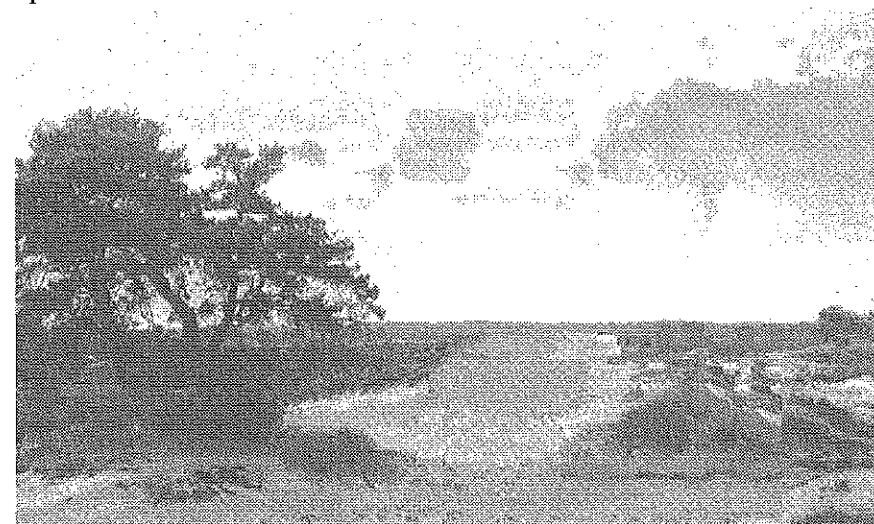
In een duingebied als boven werd een deel van de nieuwe weg aangelegd.

De paden tussen de percelen grond van Huis ter Heide tot Beukbergen liepen door een heuvelachtig terrein met zandverstuivingen. Zij waren eigendom van particulieren en daardoor was het onderhoud daarvan niet optimaal.