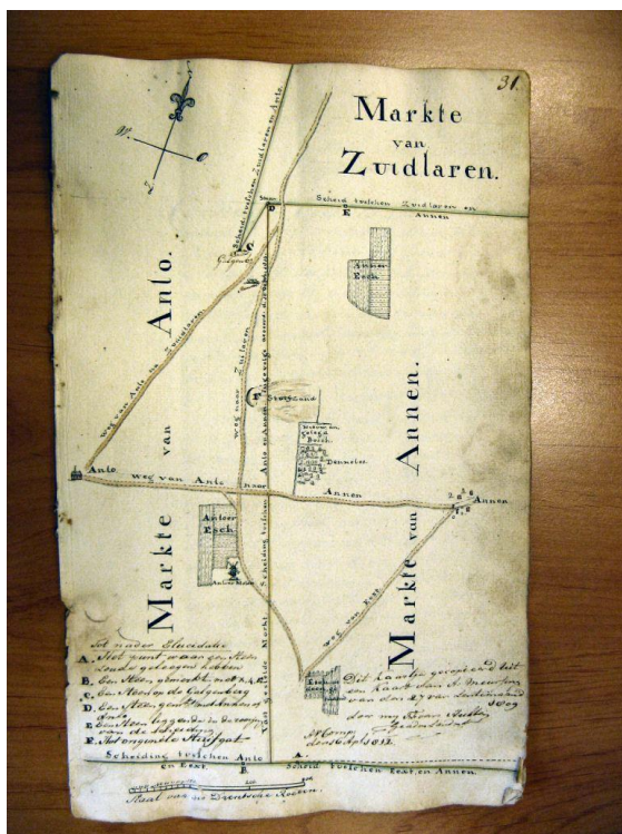
Figuur 2. Situatieschets markegrenzen, naar een kaart van Meursing.