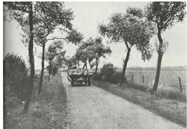
Figuur 2. De meelwaogen van de fabriek met pongen (zakken met meel/graan) op weg naar Schipborg.

Er werden uitsluitend zwartbonte koeien gehouden. Deze waren gefokt met een dubbel doel: geschikt voor melk- en vleesproductie. De koeien waren zwaarder en kleiner dan de huidige zwartbonte koeien.