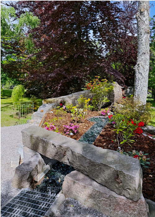
2025 – ett nytt inslag i Parken är området kring Stina Ekmans "Klocka"