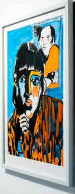
TOMAS BYSTRÖM Själuporträtt , teckning, 38x30cm, 1984, olja på duk 38x29cm, 1985 CINDY SHERMAN Fortune Teller , färgfotografi, 29x24,5cm, 1993 LOTTE LASERSTEIN Själuporträtt , etsning, 28x23cm, 1950-tal ULRIK SAMUELSON Själuporträtt , litografi, 47x34cm, 2000