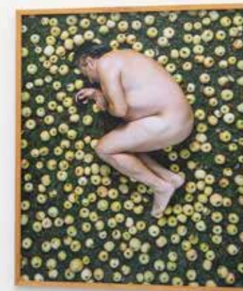
LEIF DODO CLAESSON. Skulle, Rotvälta, Fallfrukt - ur serien En början , pigment fotografi, 83x103cm, 2016-17