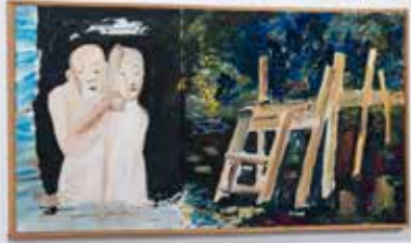
HANS WIGERT Sommarbryggan Stavnäs , olja på duk, 46x93cm, 1990 CARIN ELLBERG 9 självporträtt, nr 567-575, 13/1-26/1 , akryl på pannå, 32x25cm, 1999 (Courtesy of André Schipjenko, Stockholm, Paris) DAN WOLGERS Otoros – ormen som äter sin egen svans , tårtdisplay och trickfotografi, 48x45x33cm, 2023