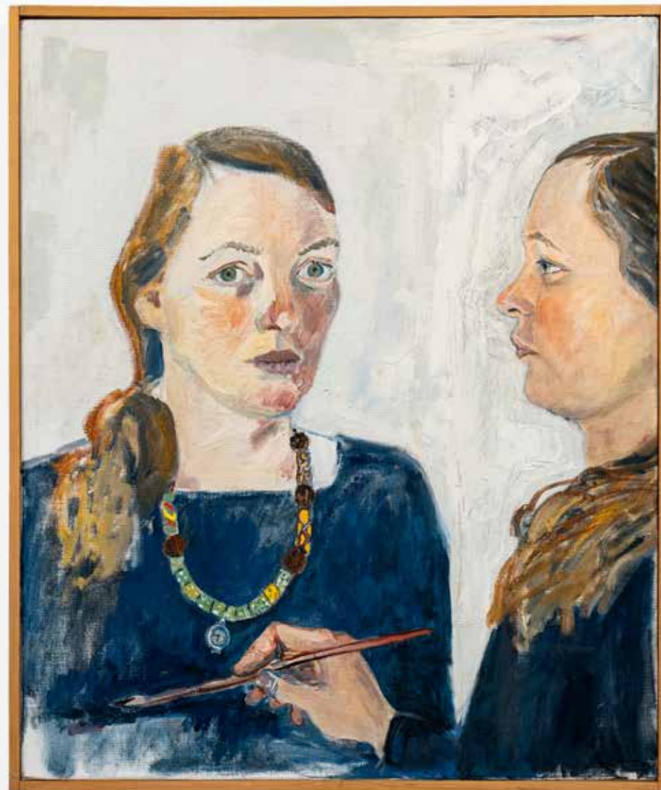
LENA CRONQVIST Själoporträtt II , olja på duk, 65x55cm, 1970-tal