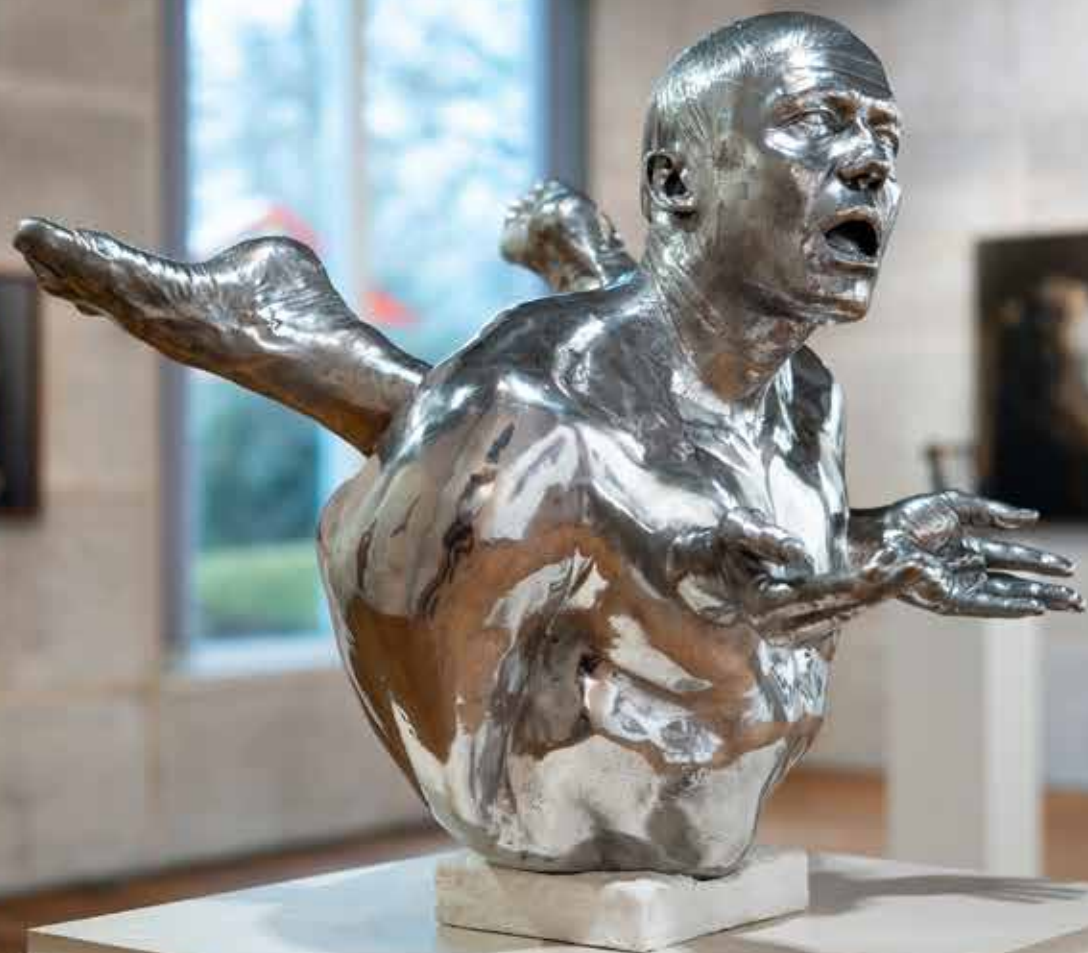
MARTIN SJÖBERG Self Portrait by Proxy , aluminium, 70x70x60cm, 2010