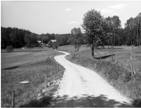
Grusväg vid Vippentorpet, Halland 1989