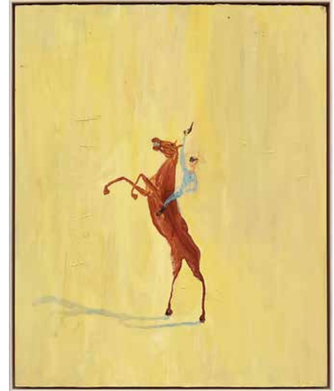
Kurt. Olja och akryl på pannå, 59x47cm, 2023