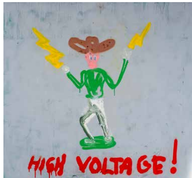
Flash Cowboy. Sprayfärg på pannå, 82x89cm, 2023