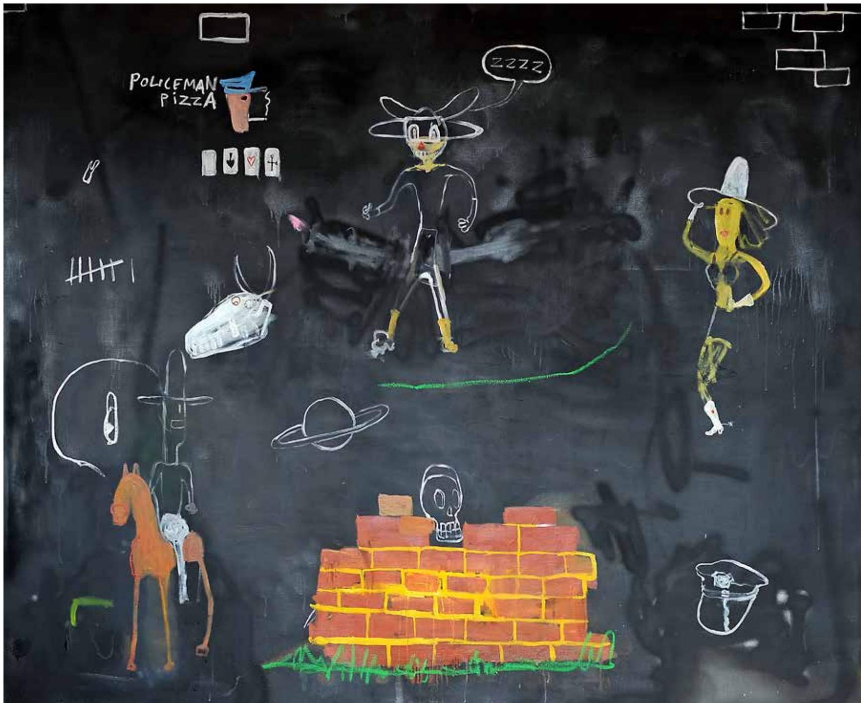
Policeman Pizza. Olja, spray och akryl på duk, 160x190cm, 2023