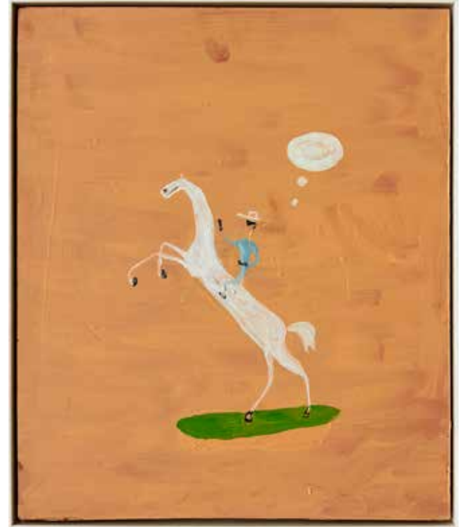
Japp goes West. Olja och akryl på pannå, 52x44cm, 2023