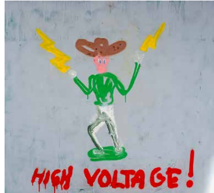
Flash Cowboy. Sprayfärg på pannå, 82x89cm, 2023