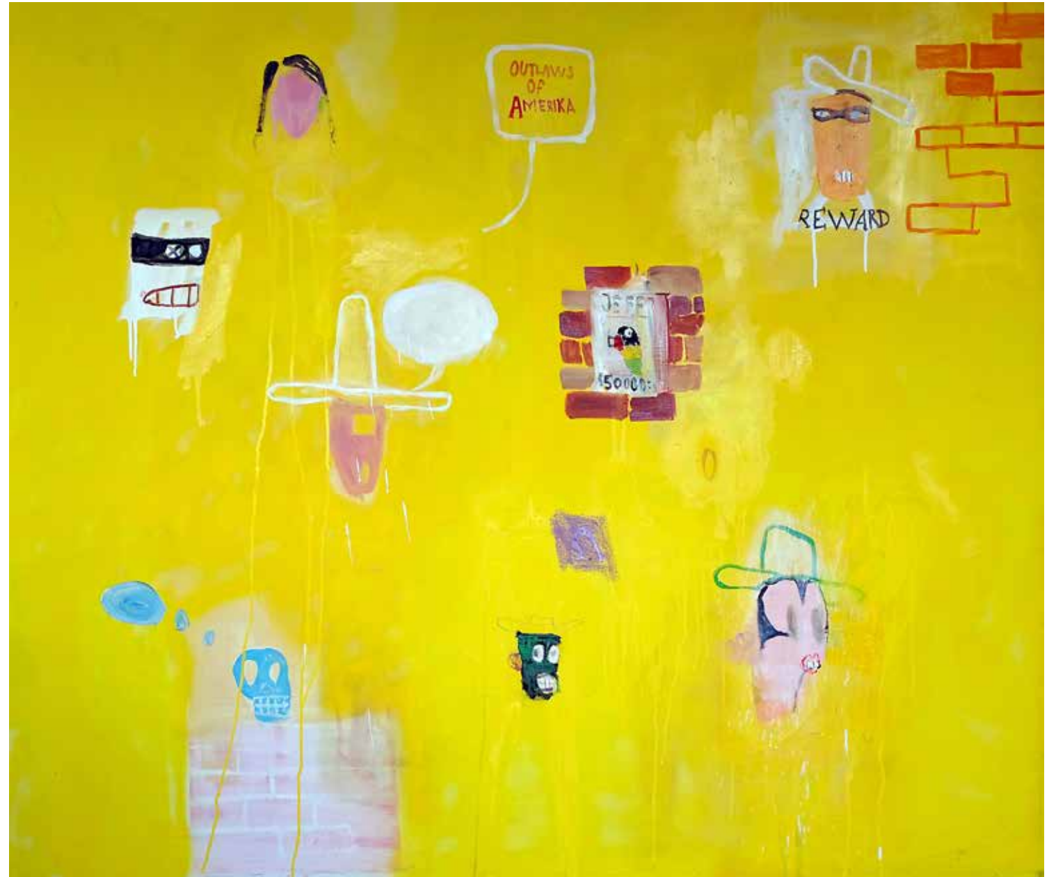
Outlaws of America. Olja och akryl på duk, 130x140cm, 2023