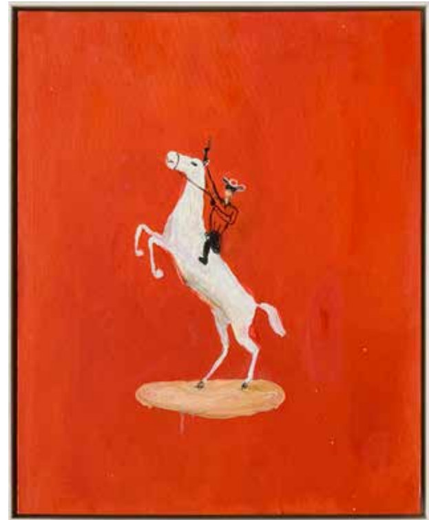
Maskerad Snövit. Olja och akryl på pannå, 52x42cm, 2023