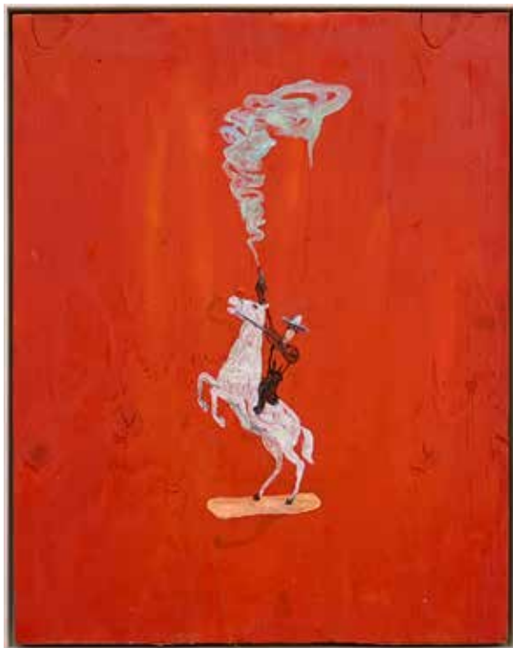
Birddreaming Cowboy. Olja och akryl på pannå, 59x47cm, 2023