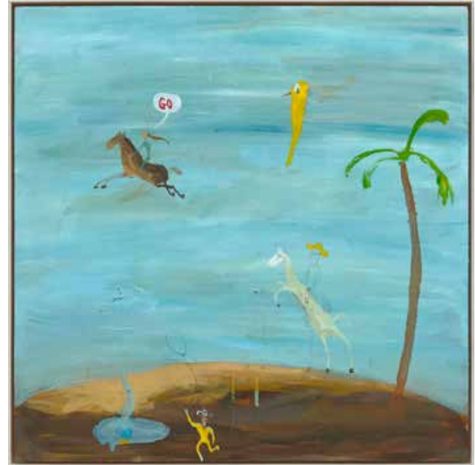
Den Heliga Natten. Olja och akryl på pannå, 62,5x62,5cm, 2023