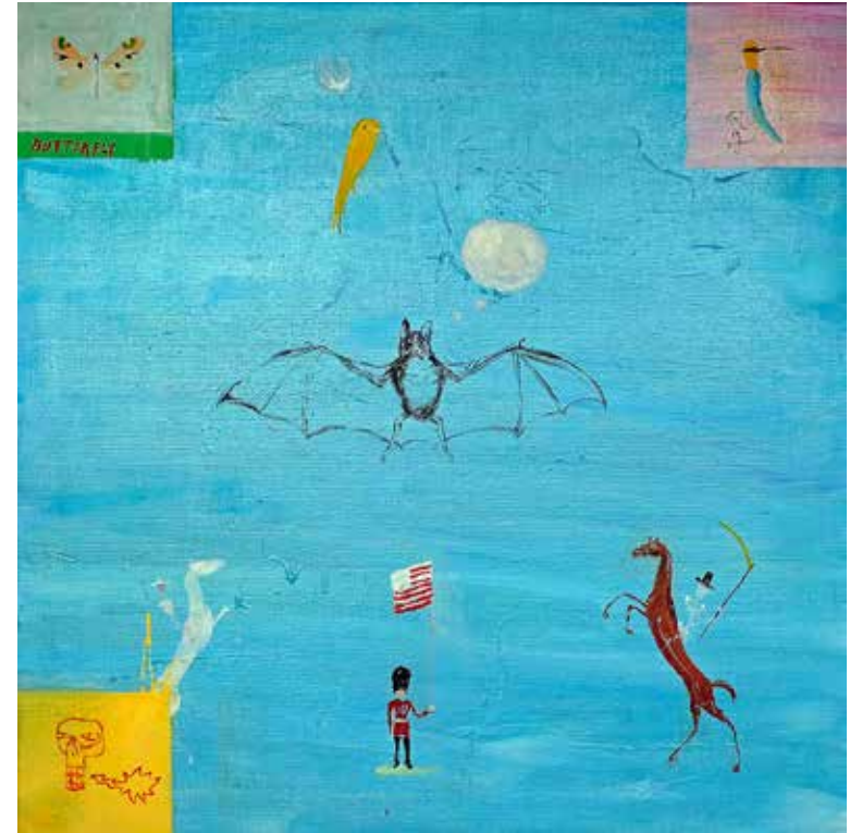
Fjärilens dröm. Olja på duk, 91x91 cm, 2023