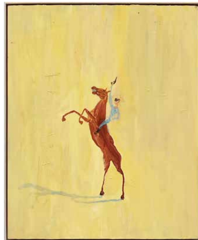
Kurt. Olja och akryl på pannå, 59x47cm, 2023