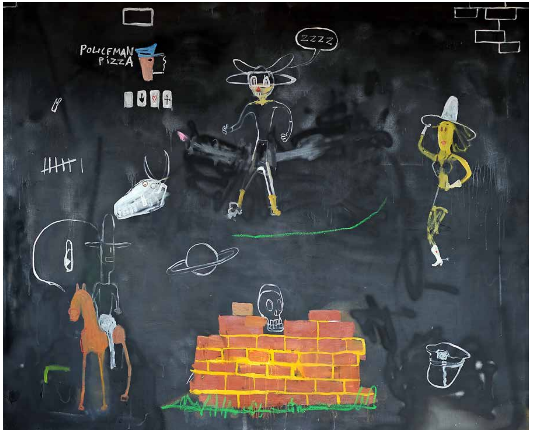
Policeman Pizza. Olja, spray och akryl på duk, 160x190cm, 2023