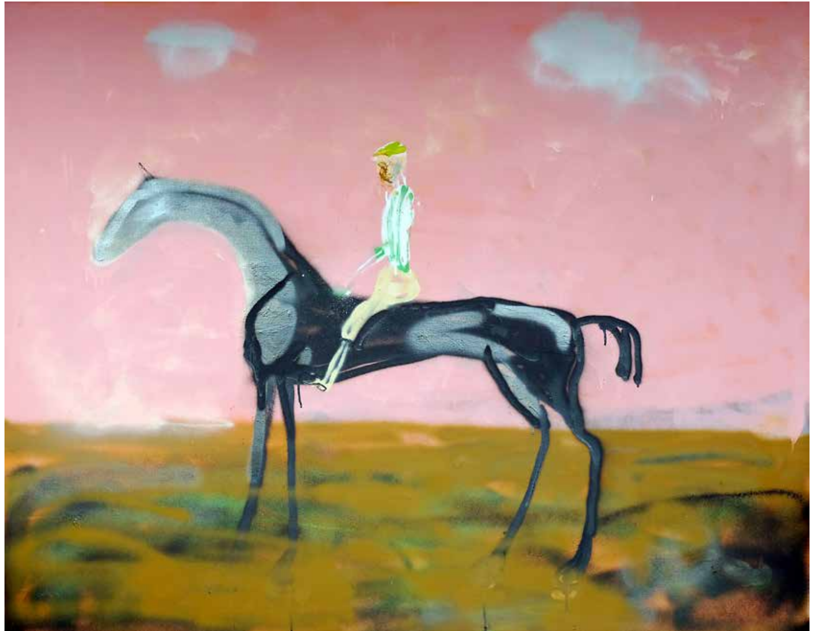
Stubbs Jockey. Sprayfärg på duk, 120x150cm, 2023