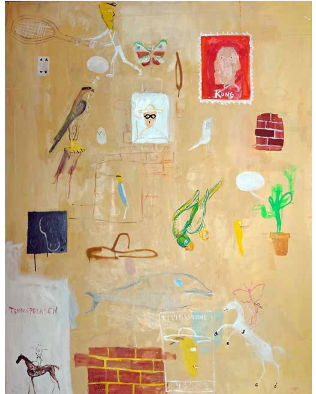
Livingstone. Olja och akryl på duk, 180x140cm, 2023