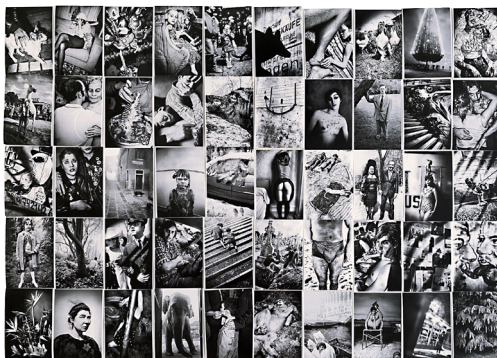
skiss för Paris exhibition 2021