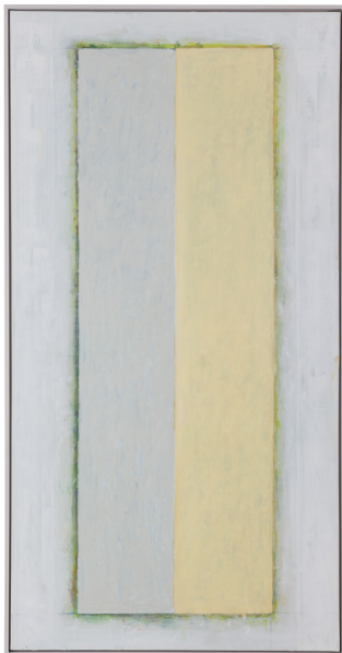
Peter Hahne; SUPERBIA I, 210x108 cm