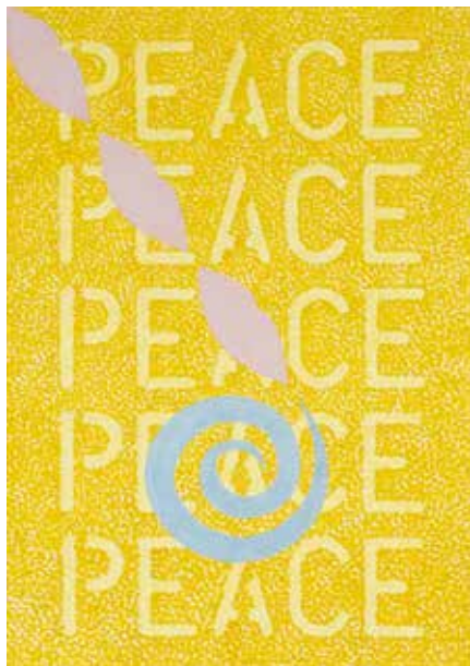
PEACE. 2019, 33x23 cm. Tempera på mdf.