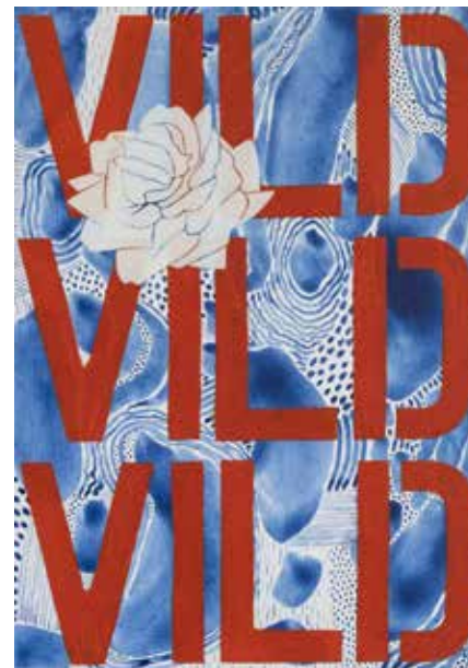
VILD. 2019, 33x23 cm. Tempera på mdf.