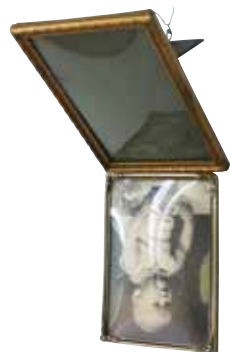
Huvudstupa 2013. Foto, glas, metall, 28x12x16 cm