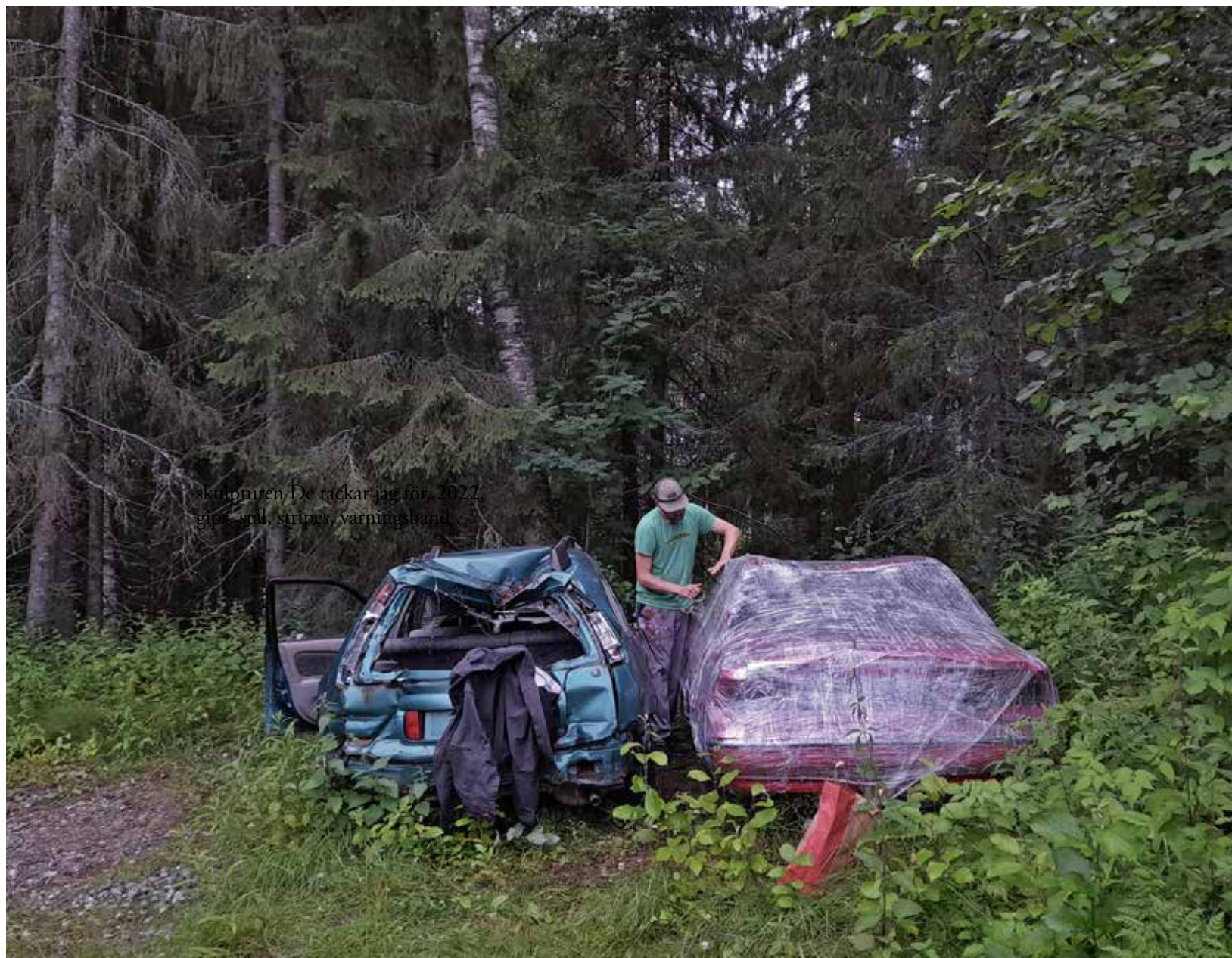
skulpturen De tackar jag för, 2022, gips, stål, stripes, varningsband.