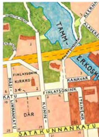
DÄR. Akvarell på papper, 50x40 cm, 2022