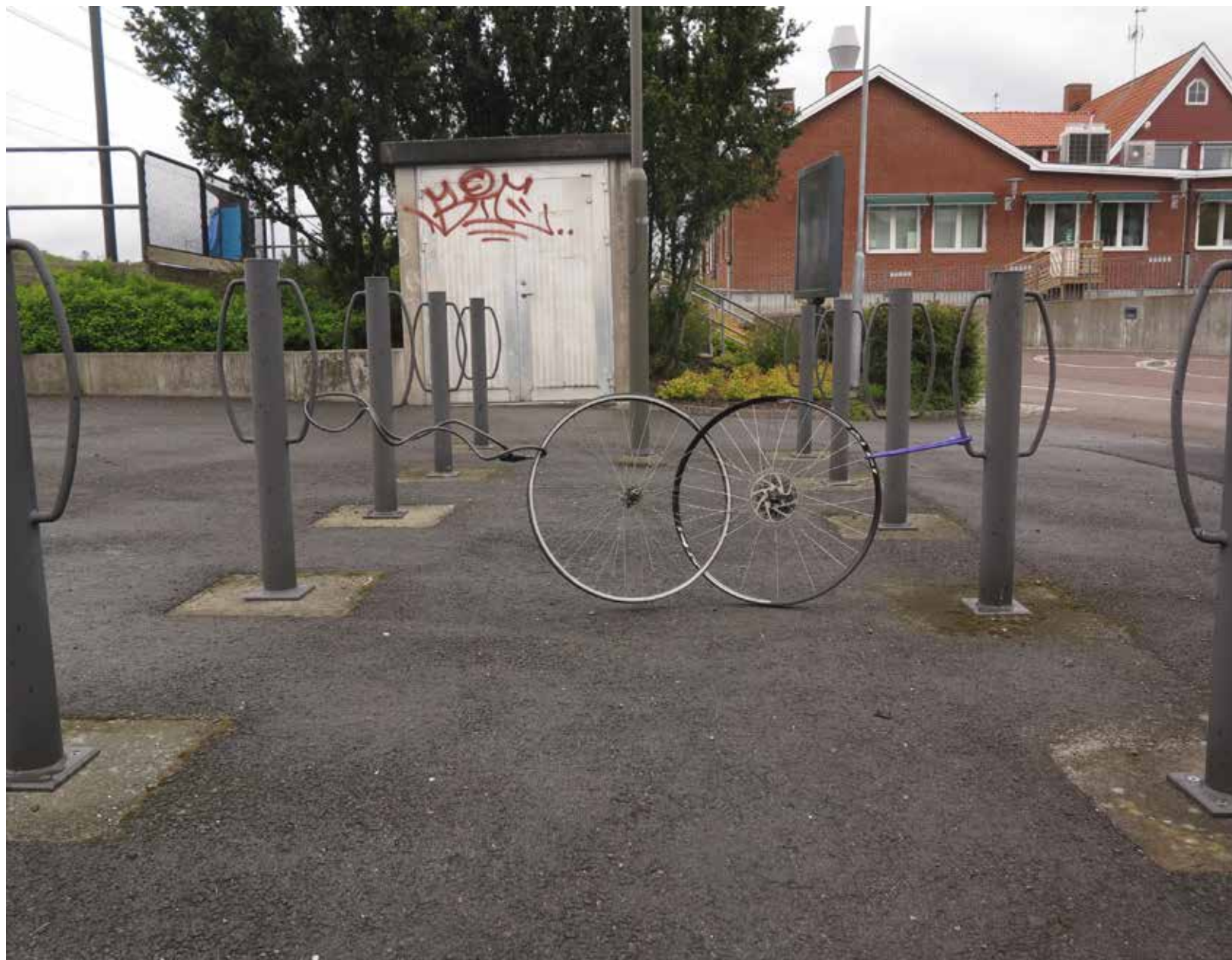
offentligt verk, Förenade Krafter: 2021, två dumpade framhjul har vävts ihop på pendelparkeringen i Källered.