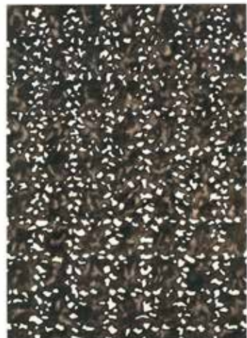
Let's Dance. Akvarell på papper, 50x40 cm, 2022 The Milky Way. Akvarell på papper, 50x40 cm, 2022