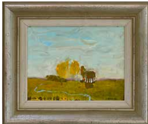
Sinclair, STIGAR ÖVER HEDEN. Olja på pannå, 27x35 cm, 1948 Omtagning av Björn Wessman, 2022. ÅMINNE