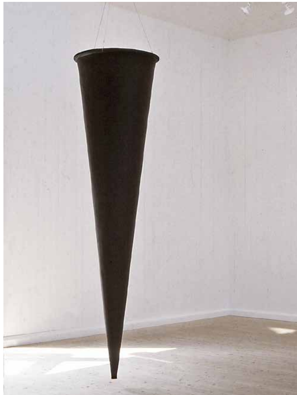
Nos 2002. Gummi, järn, h 245 cm