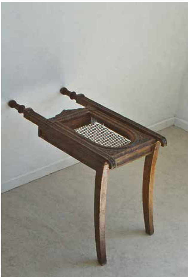
Biktstol 2001, trä, järn, h48x72x35cm