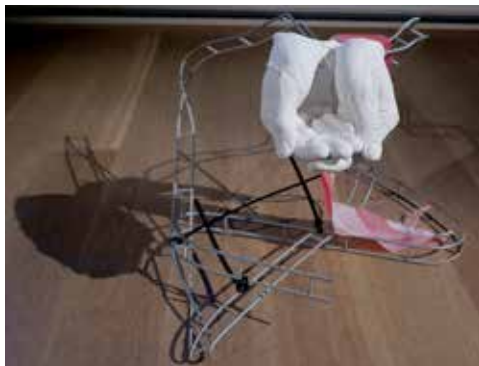
De tackar jag för, 2022. Gips, stål, stripes, varningsband.