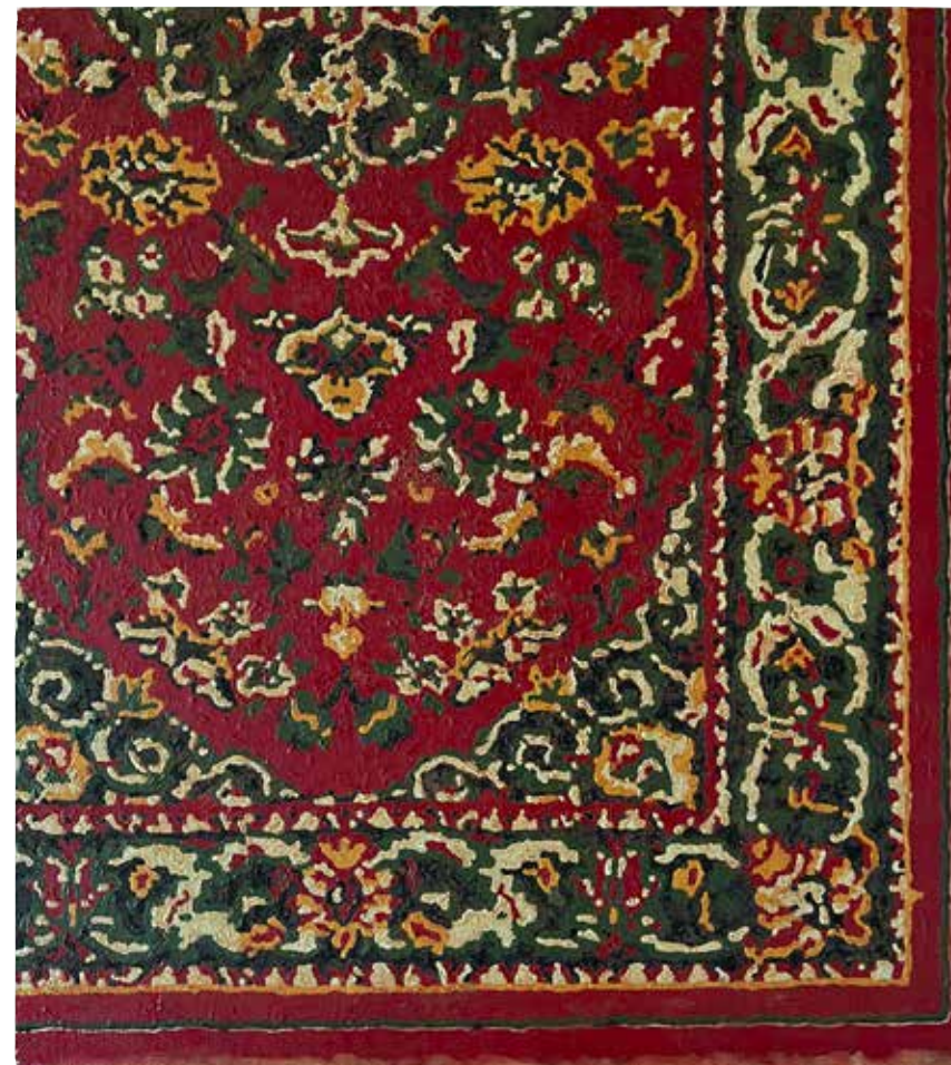
Den Persiska mattan. Olja på duk/pannå, 56x50 cm, 2000