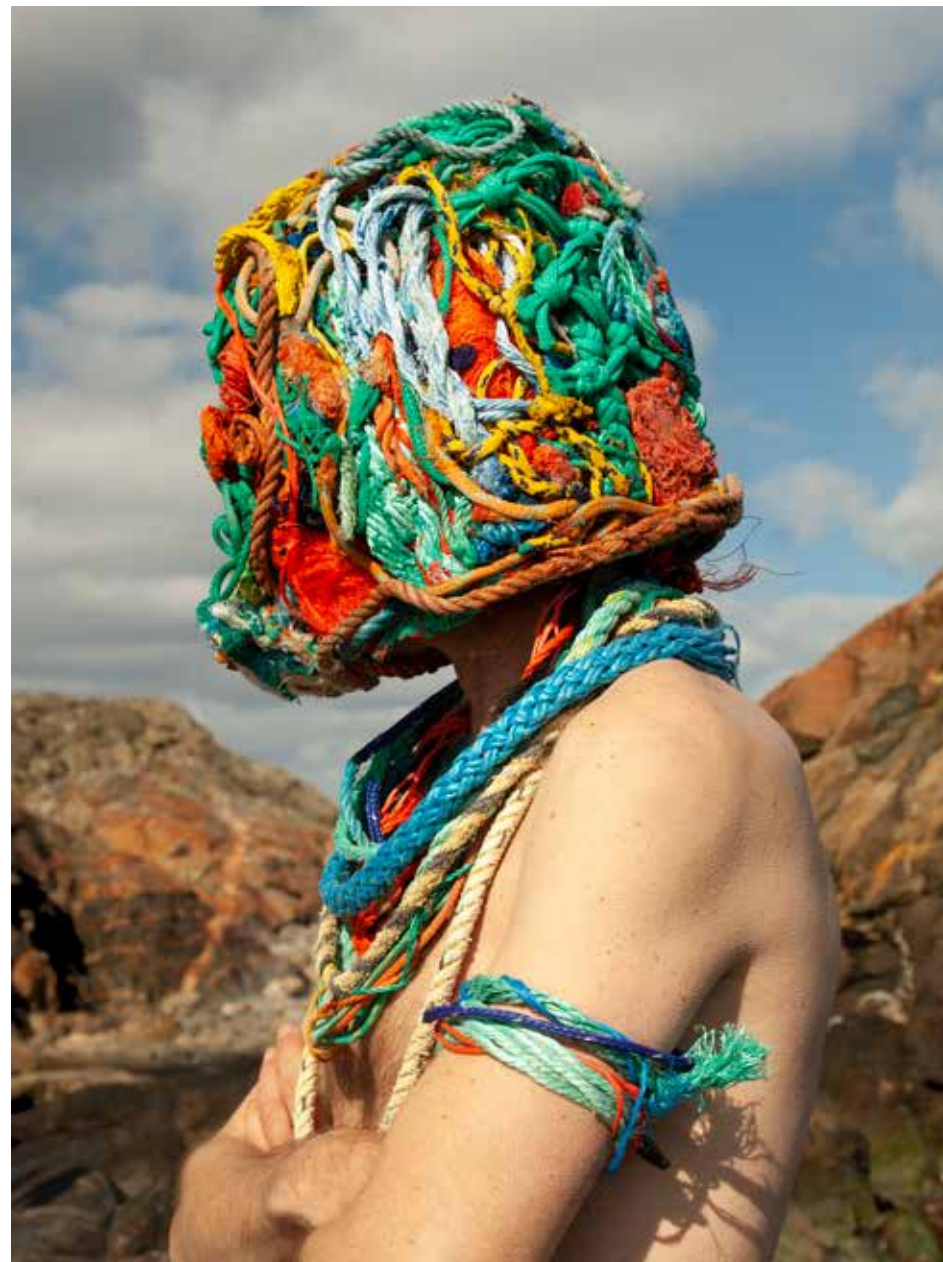
Rope Head Warrior, 2021. Foto

Men inte minst ser jag kopplingen till måleri i mina rep-verk. Färg på en rektangel. Abstrakt måleri med färgade rep i stället för oljefärg och en värmepistol och häftapparat i stället för pensel och palettkniv.