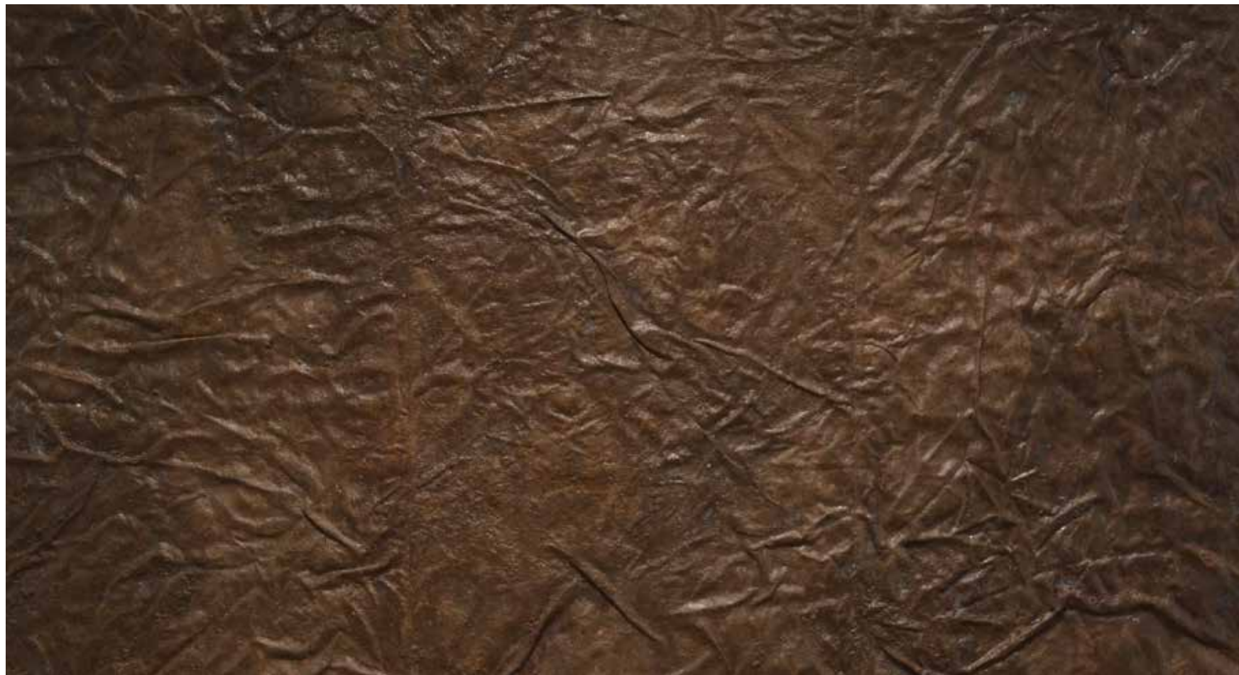
Terra, 2019 Sjukhuslakan i linne från 1950-tallets beredskapslager; jord, lim.