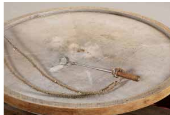
sidan 15 – Detaljbilder Diorama Rörligt objekt. Vresros och spegel Skulptur med rörliga objekt