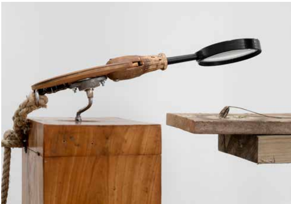
Inspektören Rörligt objekt, del av skulpturen Diorama Förstoringsglas, motor, akleja och stjärnflocka