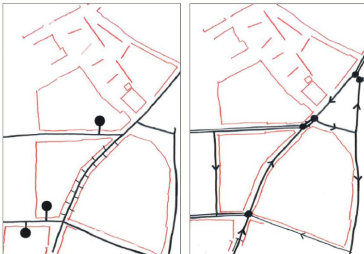
figuur 2: suggestie bevoorrading en aanbeveling voor het verkeer