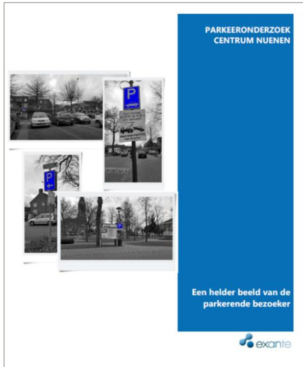
figuur 5: rapportage parkeeronderzoek centrum Nuenen

Het rapport onderkent dat er scenario's zijn voor het aanbod van voorzieningen (supermarkten, speciaalzaken, horeca) en dat keuzes in de segmentering gevolgen hebben voor (verkeer en) parkeren. Exante komt tot conclusies en aanbevelingen over de mogelijke bijstellingen t.a.v. de vormgeving, vindbaarheid en parkeernormen. Betaald parkeren is overwogen, maar afgewezen. Een maatregel die wel uitgevoerd wordt, is de blauwe zone in een deel van het centrum, om langparkeerders te weren. Deze maatregel staat tot op zekere hoogte op gespannen voet met de bedoeling het centrum verkeersluwer te maken en de suggesties vanuit de klankbordgroep Wereld van Van Gogh.