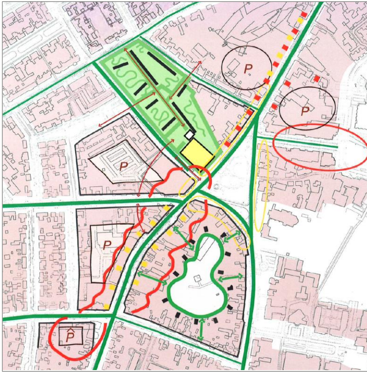
figuur 1: ruimtelijke visie voor het centrum

Concrete suggesties werden gedaan, o.a. over bevoorrading, eenrichtingsverkeer, parkeergarage Van Goghplein, parkeren middenberm Van Goghstraat etc.