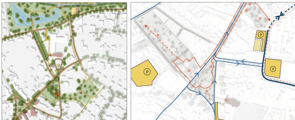
figuur 4: uitsnede uit De Wereld van Van Gogh en voorgestelde verkeerscirculatie

Deze ontwikkeling zijn we in 2017 gestart, met MTD Landschapsarchitecten als adviseur. De visie richt zich op het vergroten van de aantrekkingskracht van dorp en landschap voor een groot centrumgebied, inclusief Kloostertuin, Park, Berg en gemeentevijver tot en met de molen. Het is uitgewerkt tot een uitvoeringsprogramma met kansen voor alle gebruikers, dus bewoners en toeristen. De Wereld van Van Gogh hebben we opgesteld in samenspraak met een brede vertegenwoordiging van inwoners en andere betrokkenen.