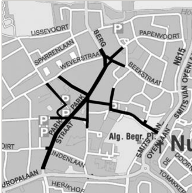
figuur 6: centrumgebied t.b.v. gehandicaptenparkeerplaatsenbeleid

Ook voor algemene gehandicapten parkeerplaatsen beschrijft het beleid hoe om te gaan met kosten, monitoring, uitvoering en handhaving.