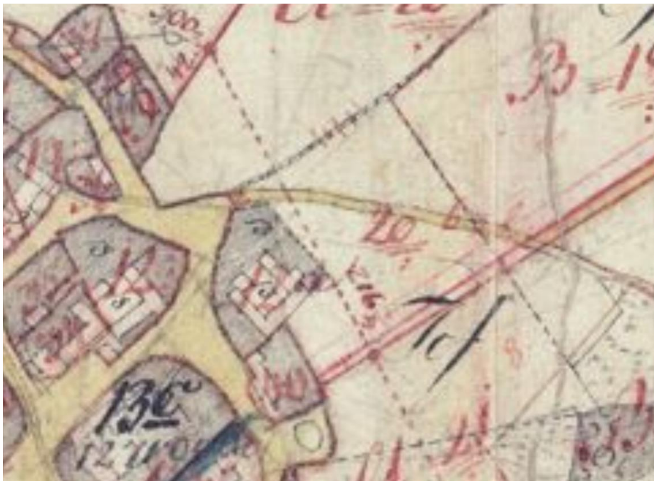
Detalje: Original 1 kort 1808-1860. Med rødt står 12 skrevet over matriklen, tidl. gård 13. Det er utydeligt hvilket bogstav, der står efter tallet. Bemærk også Kattekær nedenfor matrikel 40.