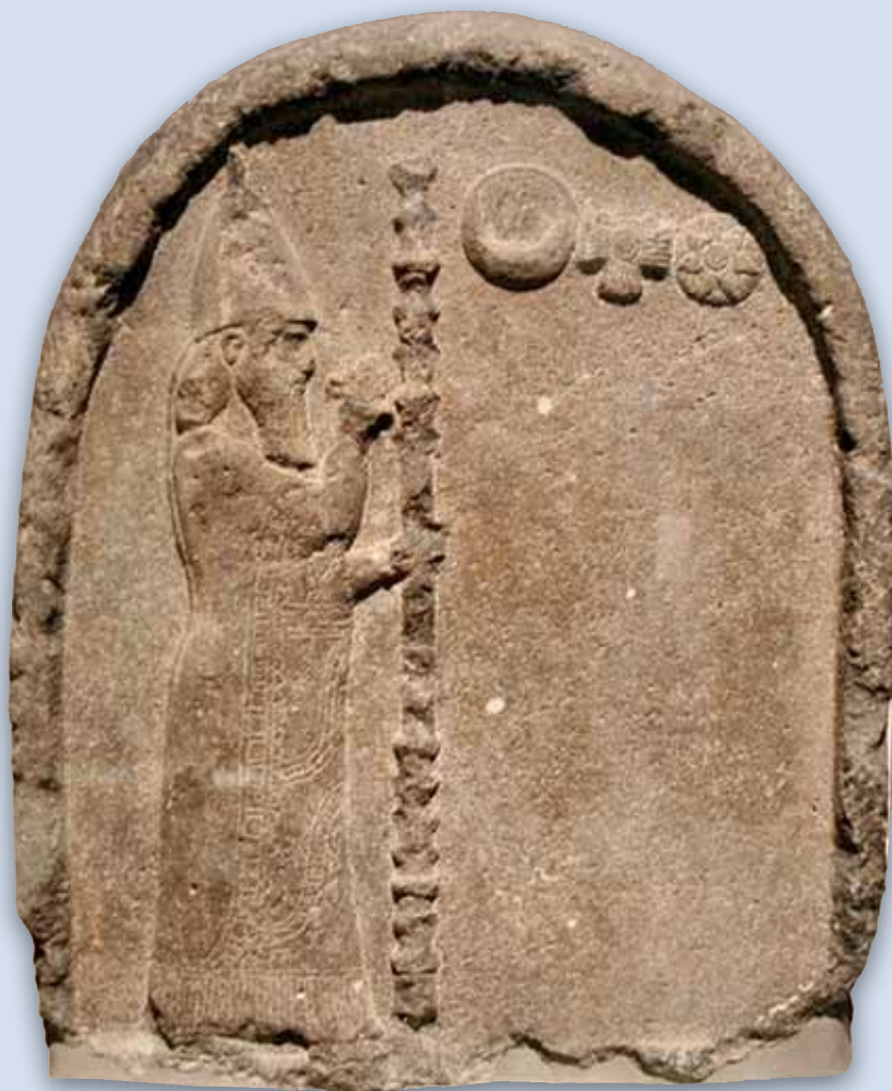
Nabonidus, de vader van Belshazzar op een stèle uit Harran (nu in het British Museum); hij was de eerste, de koning van het Babylonische rijk in het rijk; Bellsazzar zijn zoon, mederegent, de tweede en dus zou Daniël, de uitlegger de derde in het koninkrijk worden...

Daniël is er echter snel klaar mee. Zo respectvol als hij Nebukadnezar tegemoet trad, zo kortaf spreekt hij Belsazar aan. Direct en rechtstreeks spreekt hij tot Belsazar: 'U