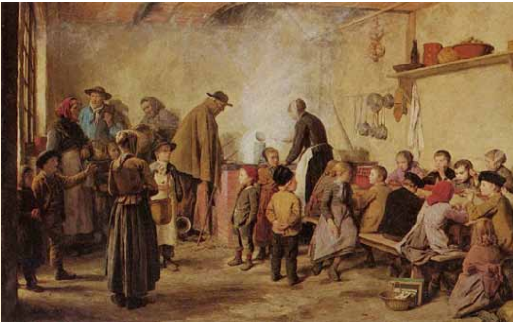
Armenzorg: Albrecht Anker (1831-1910), Die Armen- suppe, 1893; Kunst- museum Bern

ze Israëls verkenners om de stad veilig te verlaten (Jozua 6: 17). In het Nieuwe Testament wordt zij meerdere keren met ere wordt genoemd (zie ook Mattheüs 1: 5; Hebreëen 11: 31).