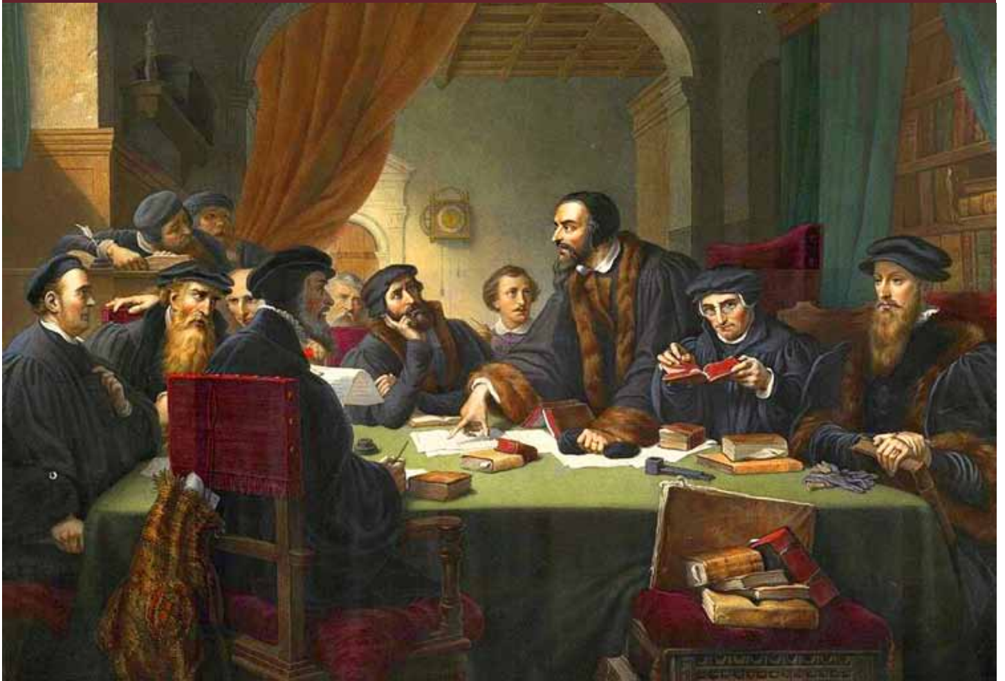
Johannes Calvijn zit een conferentie voor in 1549 te Genève; 1852, door Pierre-Antoine Labouchère (1807-1873)