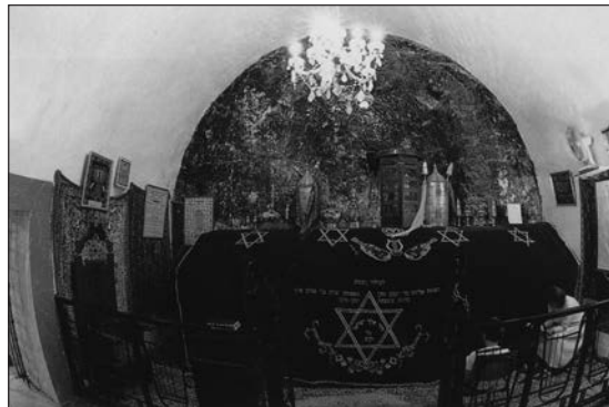
Het mogelijke graf van David.