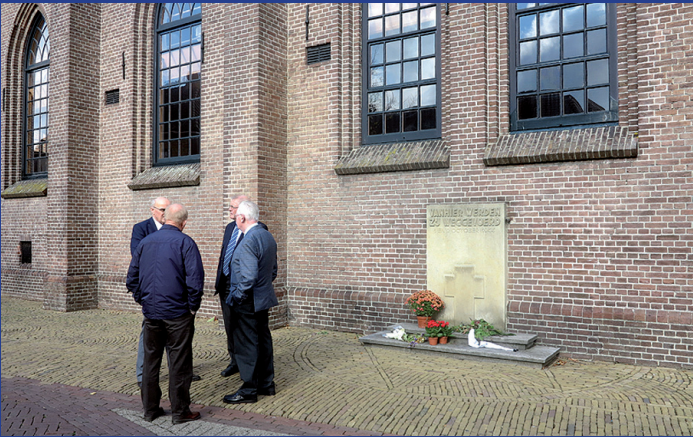
ontmoeting bij de Oude Kerk