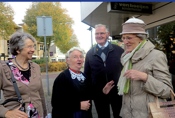
ook zij waren er