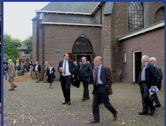
op weg naar huis