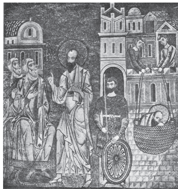
Paulus in een mand over de stadsmuur van Damascus.

Het derde heidenvolk waarover een oordeel van God gehoord wordt is Tyrus; belangrijke Fenicische havenstad ten noorden van Israël. De zonde die aan Tyrus wordt verweten lijkt op die van de Filistijnen. Evenals de Filistijnen heeft ook Tyrus namelijk het volk van God in ballingschap gevoerd en aan Edom uitgeleverd. Er staat nog bij, dat zij niet aan het verbond met hun broeders gedacht hebben. Welk verbond heeft Amos hier op het oog? We kunnen denken aan de contacten en de contracten van de Fenicische koning Hiram met David (2 Sam. 5:11v) en Salomo (1 Kon. 5:11vv; vers 12 noemt een verbond tussen Hiram en Salomo; en in 1 Kon. 9:13 noemt Hiram Salomo zelfs "mijn broeder"). Het gaat niet alleen om handelscontracten, maar ook om een vredesluiting, 1 Kon. 5:12. Evenals in Damascus en Gaza zal ook in Tyrus het vuur van God als oordeel komen. De paleizen zullen verteerd worden. Maar ook geldt: dat evenals de Filistijnen ook Tyrus in Psalm 87 wordt genoemd als in Israël ingelijfd. Opnieuw een wonder van genade.