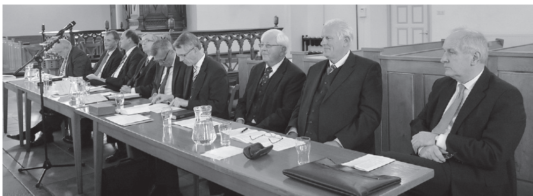
Het Hoofdbestuur met de sprekers.