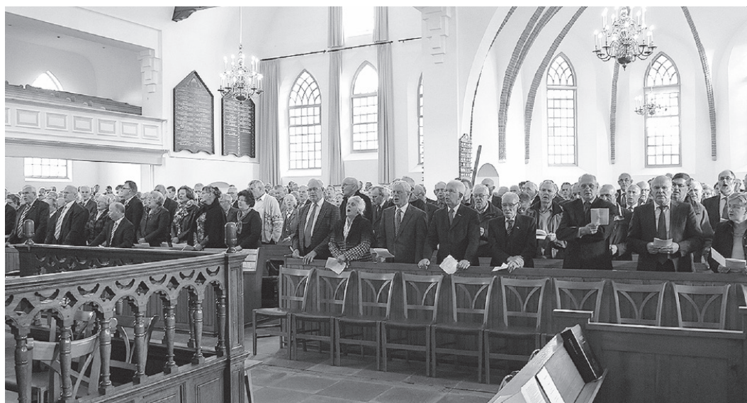
Bezoekers Bondsdag.