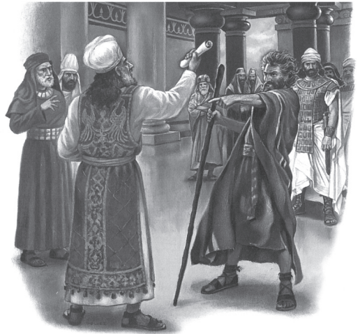
Amos wordt uit Israël verdreven en geeft nog een laatste waarschuwing aan hogepriester Amasia. (Zie Amos 7)

De Heere is middels Amos uit op de bekering van Zijn volk: Zoek de HEERE en leef, 5:6.