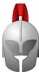
De helm van de zaligheid