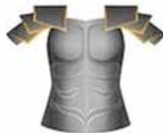
Het borstharnas van de gerechtigheid