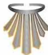
De gordel van de waarheid