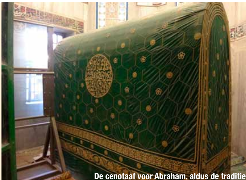
De cenotaaf voor Abraham, aldus de traditie

We hebben in tien Bijbelstudies het leven van Abraham gevolgd en ons daarbij tot hoofdlijnen beperkt. Er zou nog veel meer over te zeggen zijn. Met het overlijden van de aartsvader is dit veelbewogen levensboek gesloten. Elke biografie eindigt met de dood van de hoofdpersoon. Het sterven zet een punt achter de zin van het leven. Dat lijkt vanzelfsprekend, maar toch is het niet waar. Abraham is niet dood, maar leeft. De Heere Jezus zegt over Abraham, Izaäk en Jakob: 'God nu is niet een God van de doden, maar van de levenden; want voor Hem leven zij allen.' (Luk. 20:28) De Heiland tekent het zalige sterven van de bedelaar Lazarus: engelen droegen hem