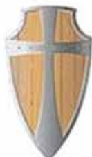
Het schild van het geloof