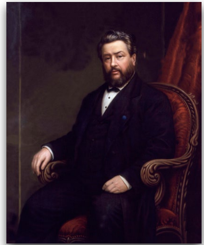
Charles Haddon Spurgeon, 1885, door Alexander Melville, olieverf op doek (101,6x127 cm), National Portrait Gallery, Londen

Laten zij dan wandelen zoals Hij gewandeld heeft. Niets kan je meer helpen om hemelwaarts te gaan, dan het dragen van het beeld van de Heere in je hart. Bestudeer al Zijn bewegingen. Op de momenten waarop je door de kracht van de Heilige Geest in staat wordt gesteld om met Jezus in Zijn eigen voetstappen te wandelen, voel je jezelf het meest gelukkig en ben je jezelf het meest bewust van het feit dat je een kind van God bent.