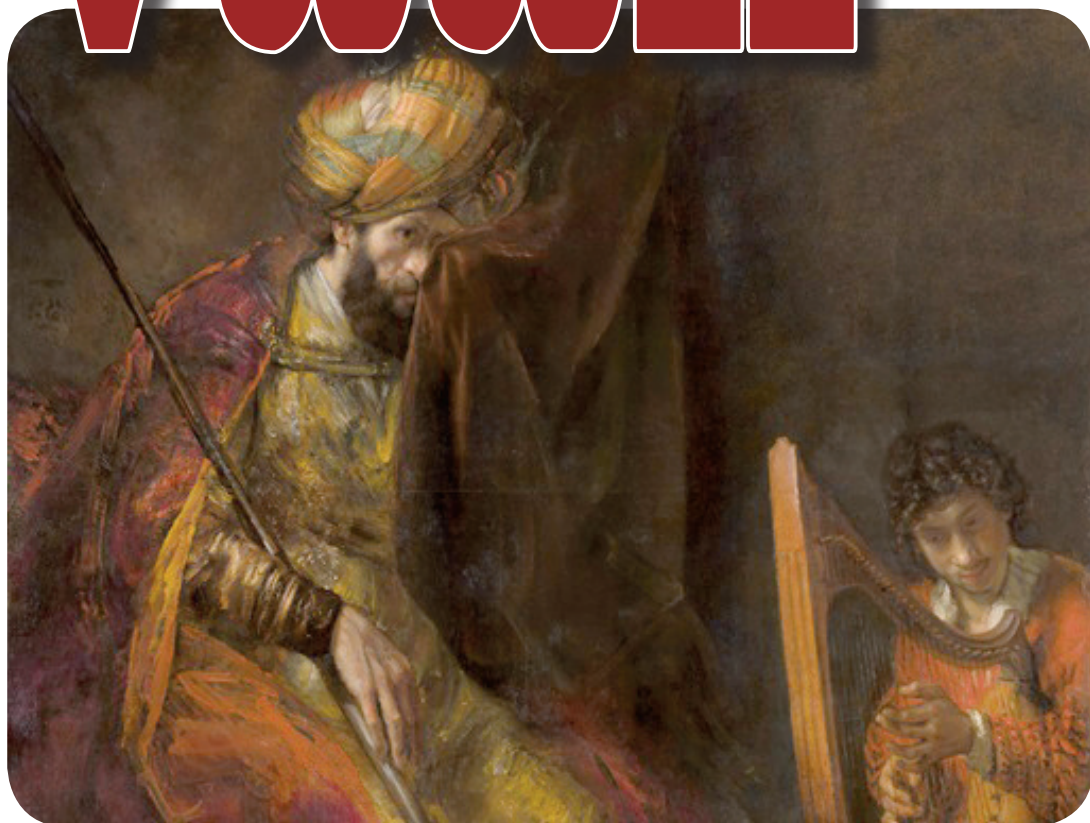
Saul en David

Orgaan van de Bond van Hervormde Mannenverenigingen op Gereformeerde Grondslag