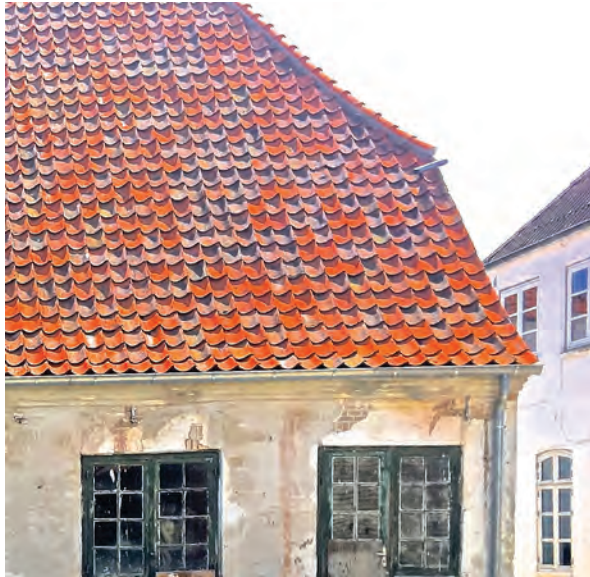
Nyt tag til Hofrådets Hus.