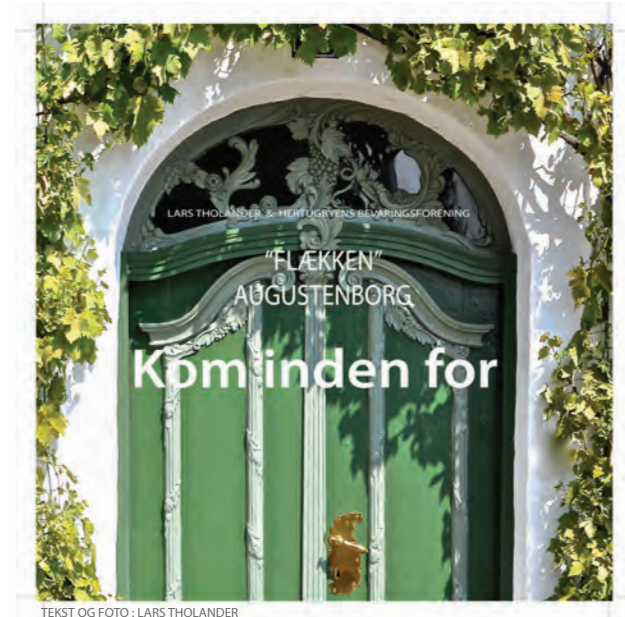
Bogen "Kom inden for", omhandler Augustenborgs fredede huse. Udgivet af Hertugbyens Bevaringsforening. Indtægt går til bevaringsarbejde i Augustenborg.

Augustenborgs historiske bykerne - og i øvrigt at fremme god bygningskultur i Augustenborg. Foreningen har i dag ca. 300 medlemmer og kan med sine midler støtte fonde og selvejende institutioner, hvis formål falder inden for foreningens formål.