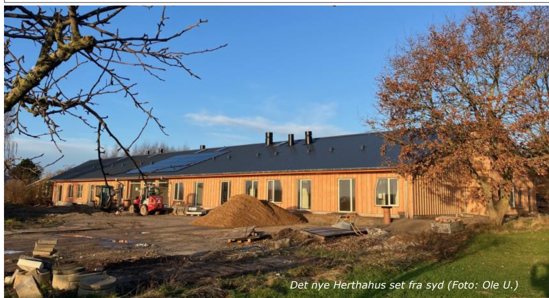
Det nye Herthahus set fra syd