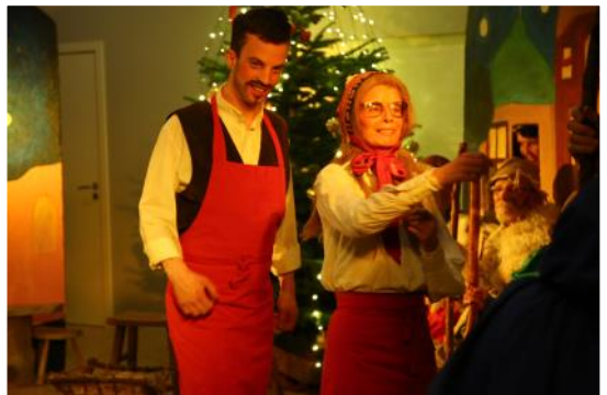
Årets traditionelle julespil i forsamlingshuset samlede fulde huse.