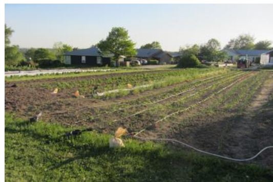
Det ser godt ud i gartneriet med alt det, der er kommet op. Sølvbeder – salat – løg – asparges mm.