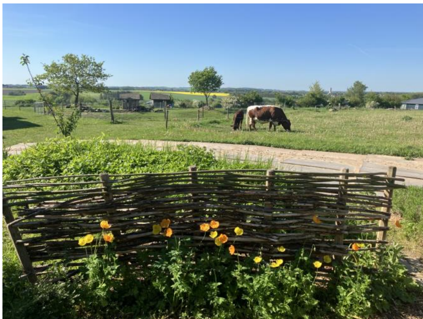
Hertha sommerlandskab