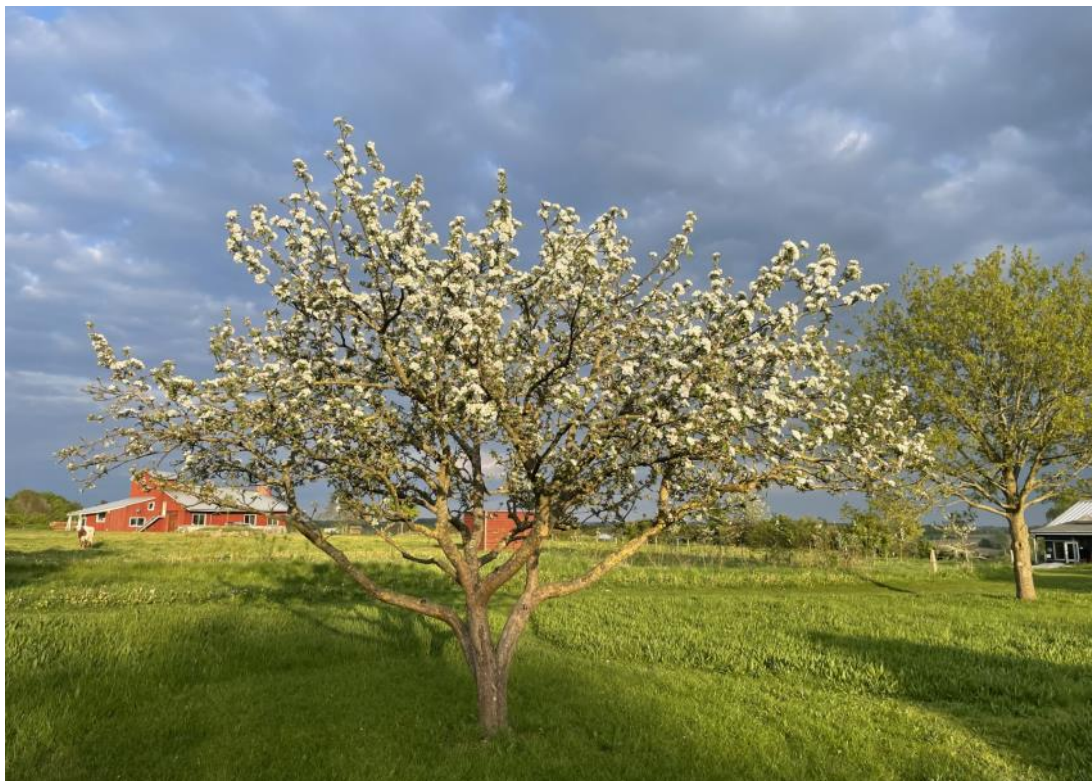
Aftensol på Livets Træ d. 8. maj. Det er som om nogen har tændt lys i blomsterne.