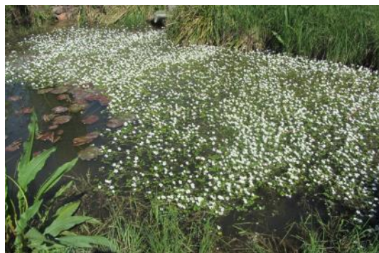
Dammen er fuld af små hvide vandane-moner (Fotos og tekst: Rita)