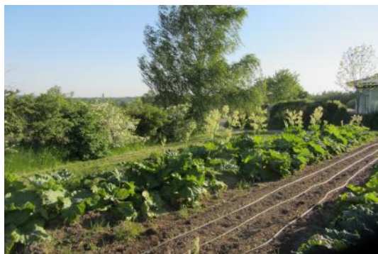
Dejligt, vi må høste rabarber