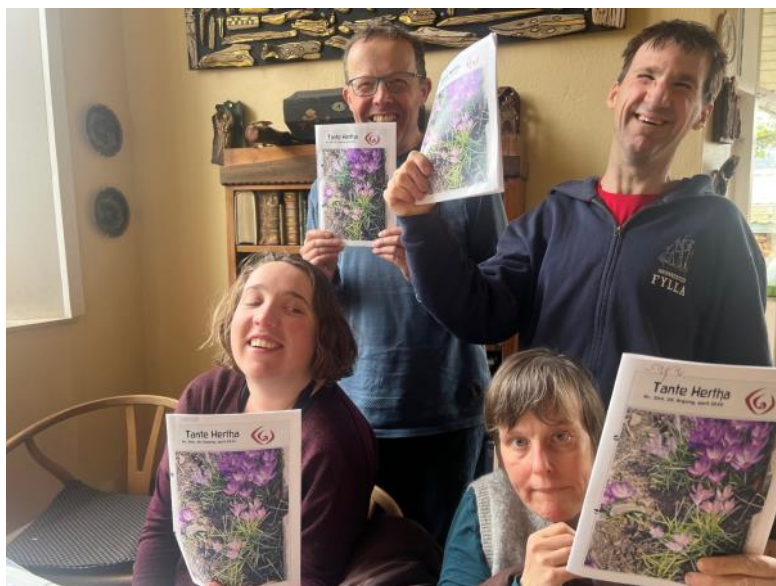
Glade danskstuderende hos Helle med deres favorit skolebog