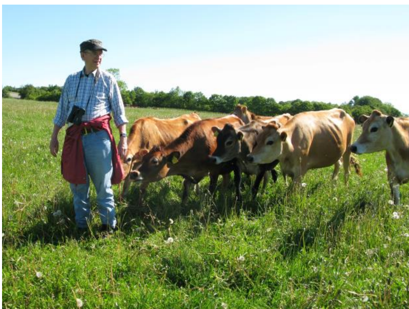
Fotografen i felten

P.S. Tante Herthas mailadresse til fotos: tante@hertha.dk. Eller kom forbi med en usb-stick ell.lign.