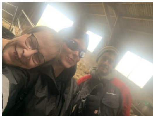
Sådan ser arbejde i stalden ud, når man har allergi :- )