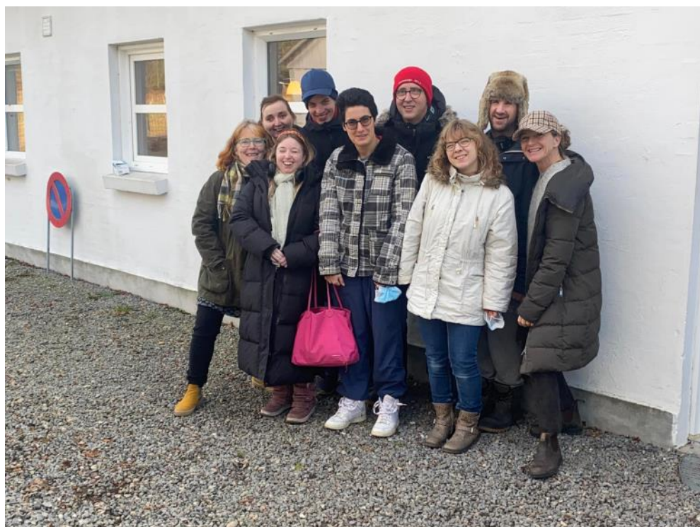
Efter negativ test i sommerhus i Ebeltoft- og så skal vi hjem...