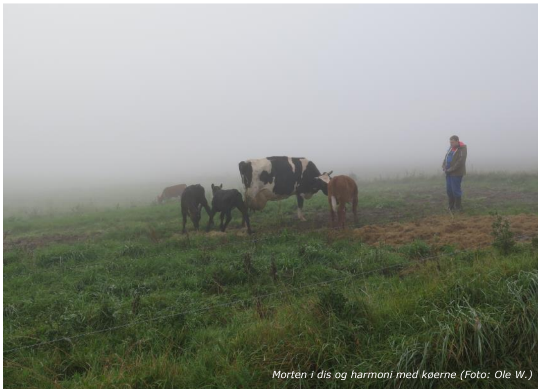
Morten i dis og harmoni med kørne

Hertha har en oversigtsartikel i Galten Lokalarhivs Årsskrift. Årsskriftet er set til salg i Brugsen.