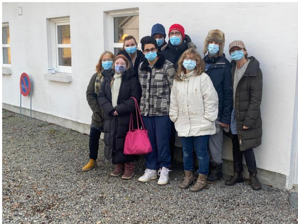
Efter positiv test i sommerhus i Ebeltoft