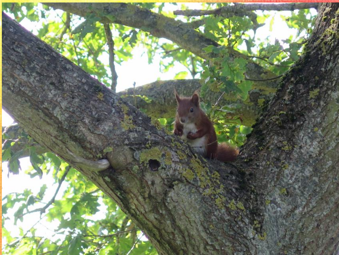
Der er egeren i Hertha! Her fanget i træet ved Vævestuen.