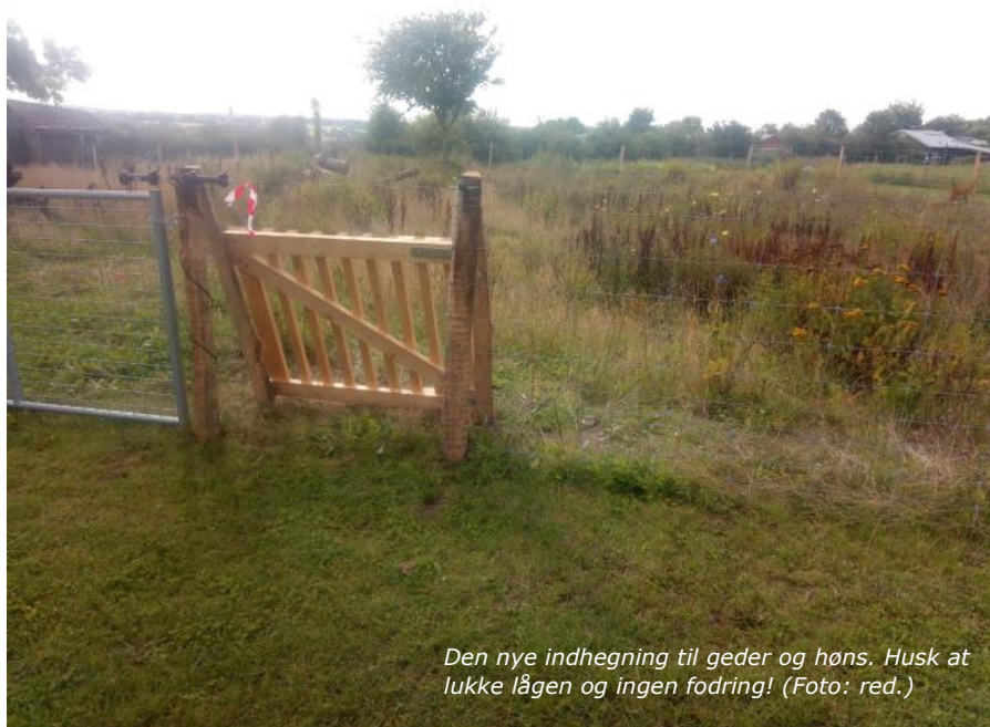
Den nye indhegning til geder og høns. Husk at lukke lågen og ingen fodring!