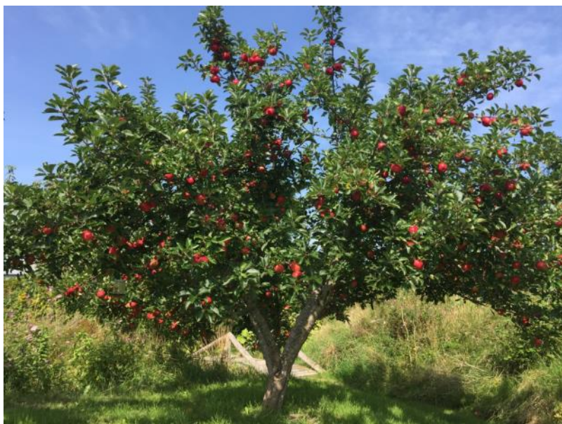
Måske er DET Hertahas smukkeste træ - lige nu?