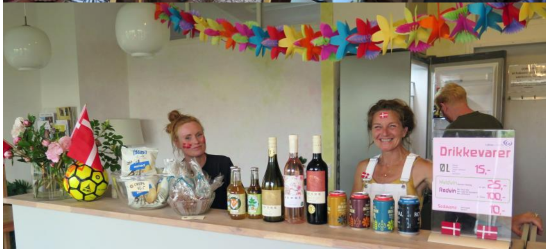
God stemning i caféen d. 7/7 ved fodboldsemifinale