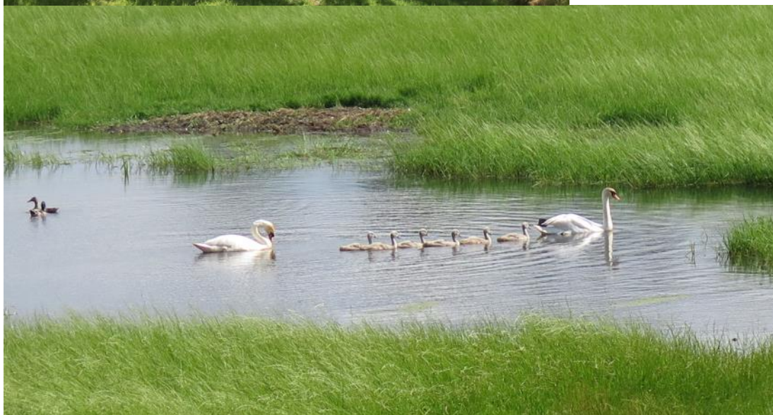
Svane i åen med seks - svellinger....?