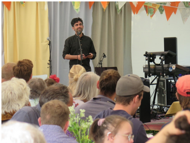
Tale til jubilæumsfesten (se hosstænde side)