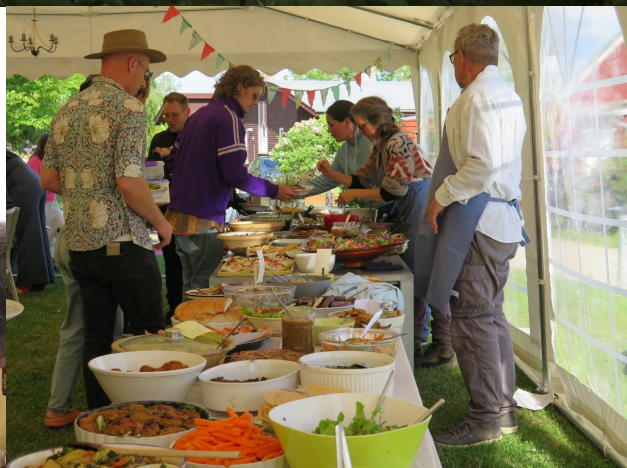
Stor som lille bidrog til en god fest - også i baren.