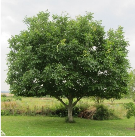
Valnøddetræ i haven ved nr. 24.