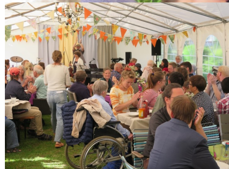
Herover: Mange hyggede sig - endelig kunne der festes igen!