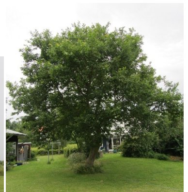
Egetræ i baghaven ved Vævestuen