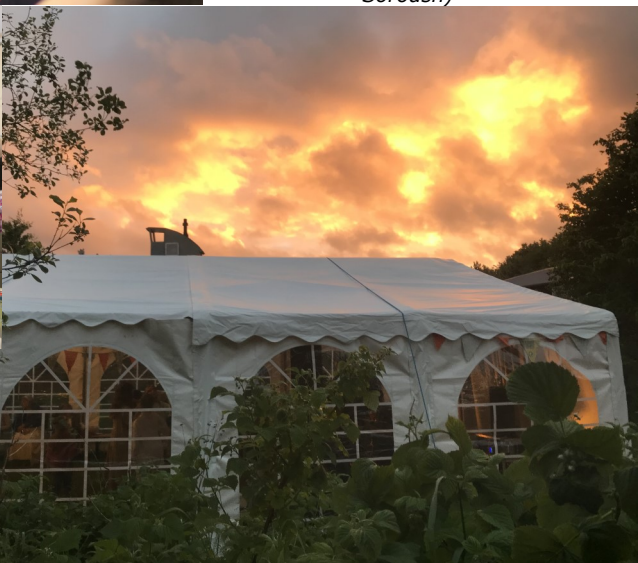
Teltbillede med solnedgang og bandet går på.