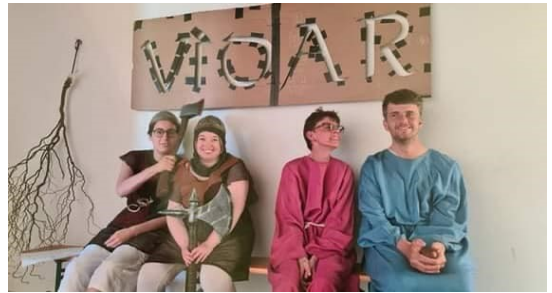
Efter lang tids øvning blev sagnet om Vidar d. 2. juni opført som skyggespil for små grupper af publikum. En optagelse af spillet kan ses på Youtube: https://youtu.be/oYa_J3LNwAM