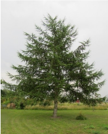
Lærketræ på Vestrondellen

Jeg er ude af stand til at klassificere det smukkeste træ.