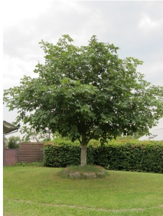
Kastanjetræ ved nr.14