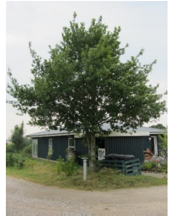
Egetræ ved Demetervænget 1