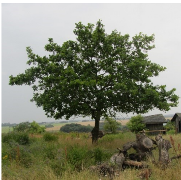
Egetræ ved Stalden