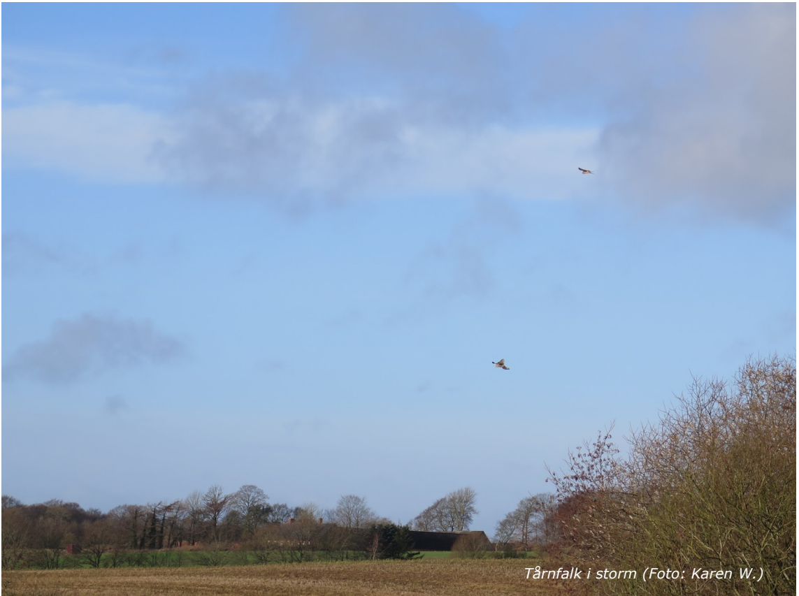
Tårnfalk i storm