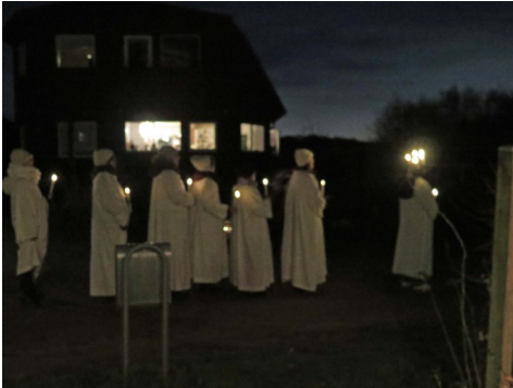
Lucia-optog i Hertha