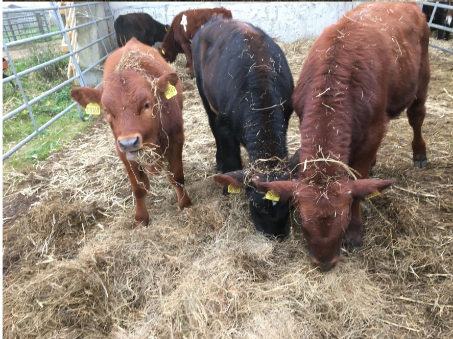
Anton i modlys og kalve, der hygger sig i det nye hø.