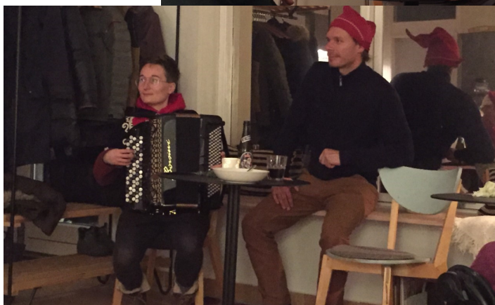
Julnissegrød i caféen