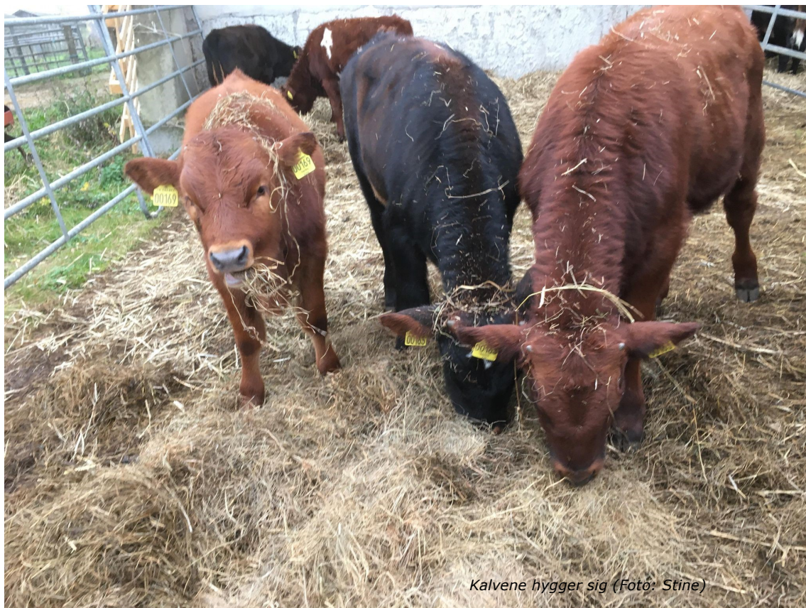
Kalvene hygger sig