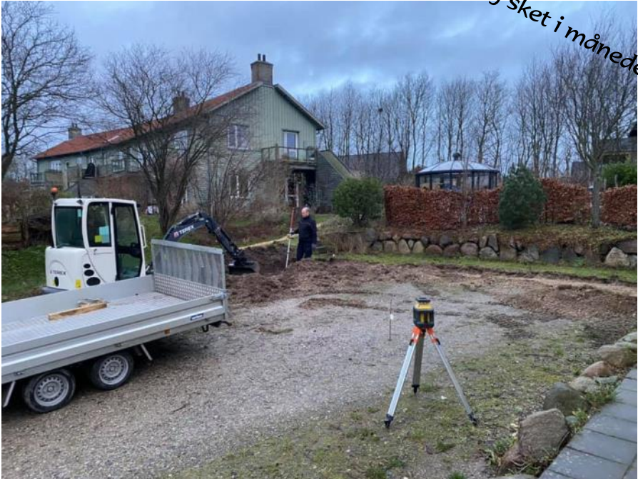
Der støbes sokkel til den nye butik