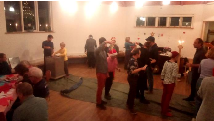
Medarbejdere, bestyrelse og terapeuter holdt julehygge med bl.a. lysedykning d. 28/11 efter medarbejdermødet