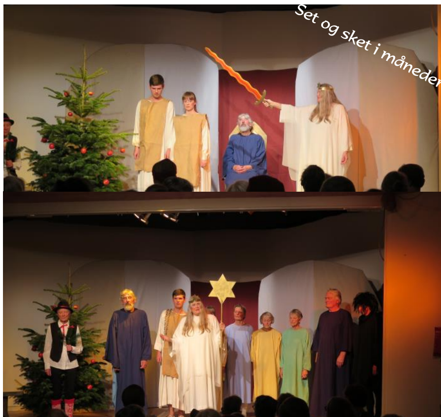
Paradisspil d. 12/12.