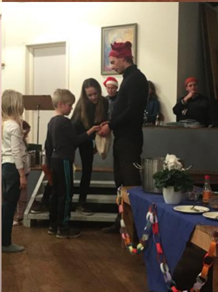
Indtryk fra den hyggelige Grødnisseaften d. 6/12.