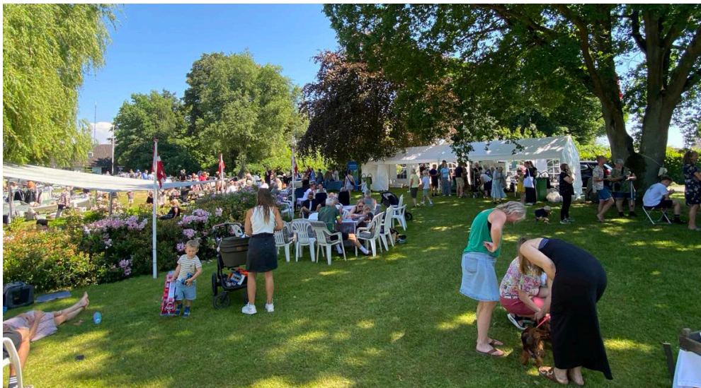
Loppemarkedet holdes 18. maj 2025.