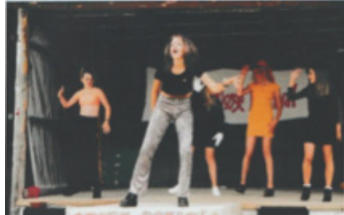
Spice Girls på Store Scene.

Der var flere dansearrangementer, og festen varede natten igennem. Klokken 4:32 søndag morgen blev flaget hejst til trompetspil, og dagens hovedattraktion var børnenes imitation af Spice Girls. De høstede enorme klapsalver.