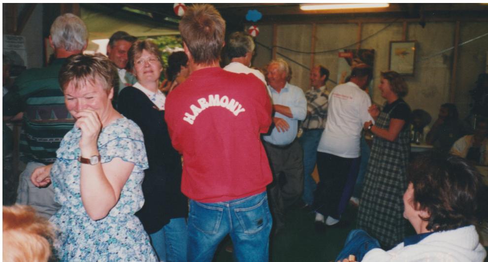
Få hele historien om Lille Herringløse Festival - side 14