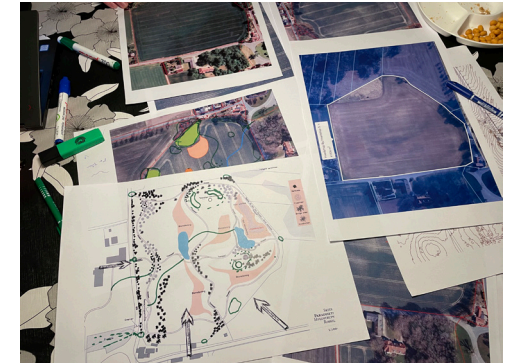
Der planlægges på livet løs

For lidt over et år siden blev ideen om Paradisets Have født, og vi er nået langt siden da. Ideen som udsprang dengang, var at tage en lille portion af kirkens marker, tage det ud af drift og udvikle et område som giver sted og rum for landsbyernes beboere og omkringliggende børnehaver og vuggestuer at færdes i og nyde naturen.