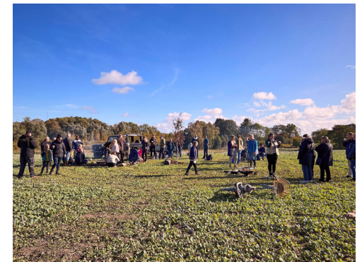
Høstgudstjeneste i efteråret 2022. Mange kom forbi for at overvære første spadestik