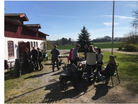
Poddeevent i påsken 2022