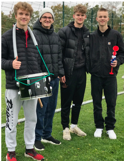
Invitation til at se god fodbold - side 18