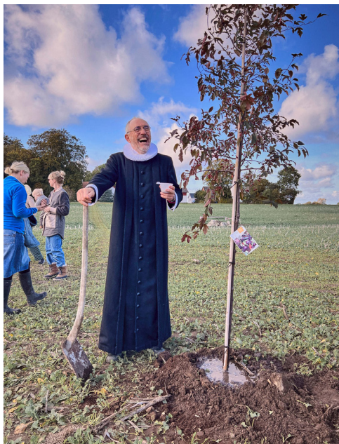
Præsten plantede det første træ - side 10