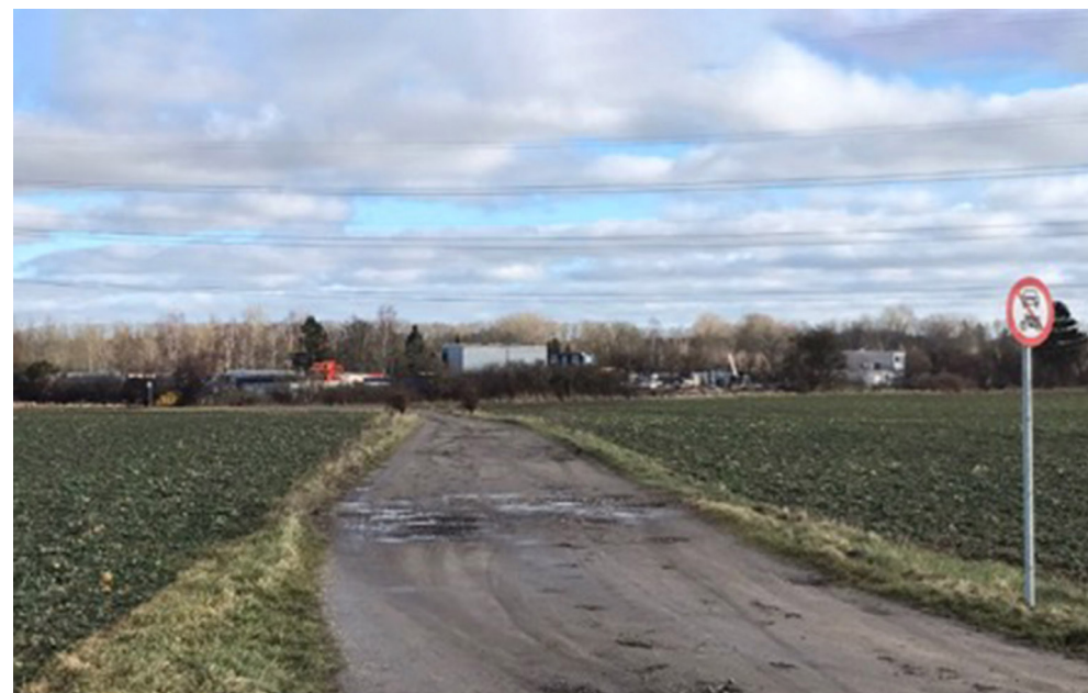
Alle pavilloner – også dem i flere etage skal være væk 01 OKT 2022. Bemærk forbudskillettet – men der er stadig rigtig meget trafik til og fra Kalkgravsvej nr 10 via Arnishøjvej. Når Arnishøj vejen lukkes/spærres helt på strækningen her flytter al den trafik over på Kalkgravsvej

Sundhedshuset, Himmelev Bygade 49, 4000 Roskilde