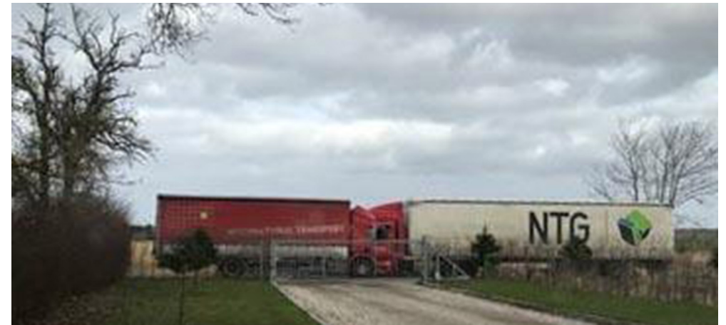
Her er det ikke sjovt at være den lille – lignende situationer opstår mange gange i løbet af ugen flere steder på Kalkgravsvej

lovligt udvider deres forretning med de gener det har i form af øget person- og lastbiltrafik. Det betyder altså fortsat store gener for beboerne på vejen og i nærområdet i form af støj, støv, vibrationer/rystelser i husene med fortsat revnedannelser samt mange trafikfarlige situationer for alle som færdes på Kalkgravsvej.