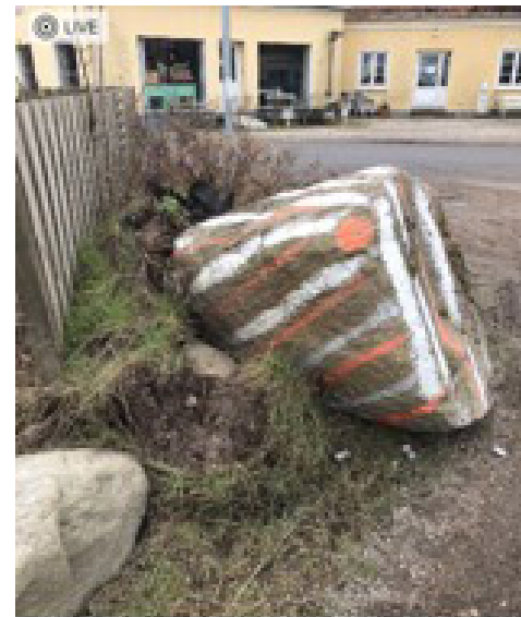
Tons tung sten flyttet af lastbil. På hjørnet forsøger ejeren at beskytte sit hegn og stensætning – her primo marts 2022 gik det galt.

lovligt udvider deres forretning med de gener det har i form af øget person- og lastbiltrafik. Det betyder altså fortsat store gener for beboerne på vejen og i nærområdet i form af støj, støv, vibrationer/rystelser i husene med fortsat revnedannelser samt mange trafikfarlige situationer for alle som færdes på Kalkgravsvej.