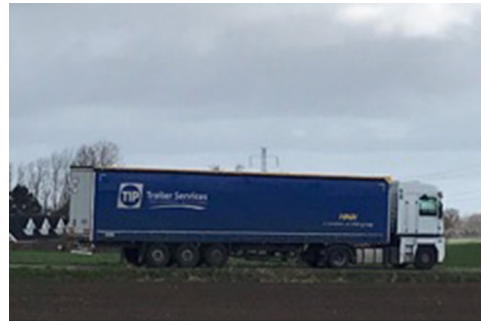
Sættevogntræk som der kommer ca. 6-8 af om ugen til nr 10.

Så der vil fortsat dagligt være mindst 40 personbiler, 4-6 kurertransporter, 5-8 fragtlastbiler/-sættevogne samt alle Thers' stillads lastbiler og ladvogne (ca 10-15 stykker om dagen) der skal til adressen – og de skal derfra igen. Altså dobbelt op på antal gange der er køretøjer på Kalkgravsvej alene til erhvervsområdet/oplagspladsen på nr. 10.