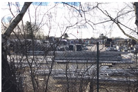
Lidt af det oplagingsmateriel som er på adressen – vi kan konstatere at der kommer mere og mere = mere lastbiltrafik

Vi er klar på at det er vigtigt at der er arbejdspladser i området, men det skal da passes ind