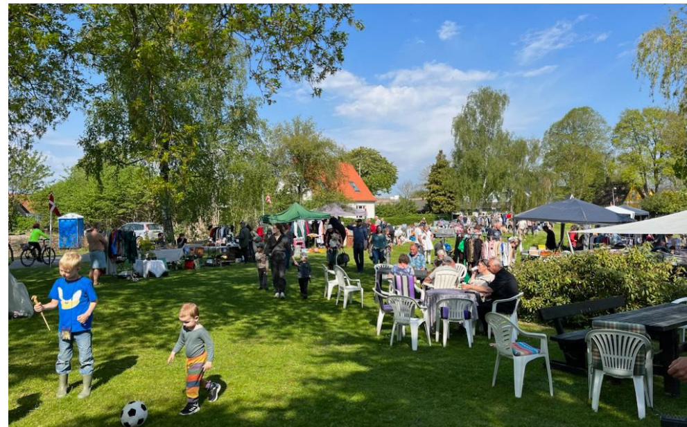
Vi gør det hele igen i 2024 og glæder os allerede.