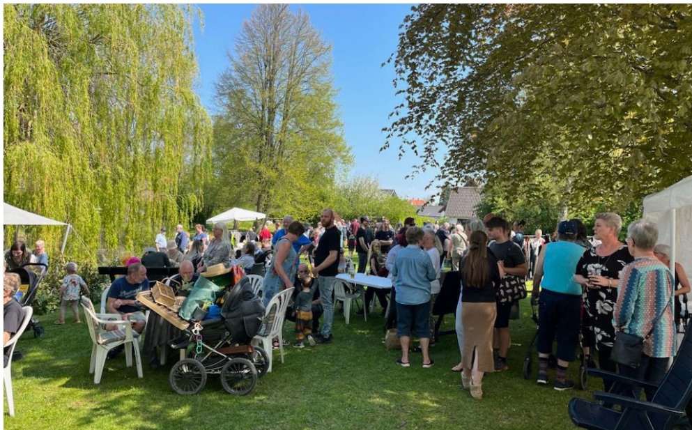
Vejret endte med at vise sig fra den pænere side