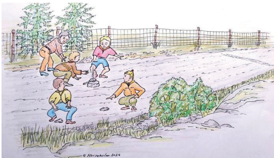
Teckning G Horseholm

Som barn lekte man oftast ute, mest i skogen eller på grusvägarna. En av lekarna som jag och mina lekkamrater i Segeltorp tyckte var rolig, var den vi kallade "att spela Pimpen".