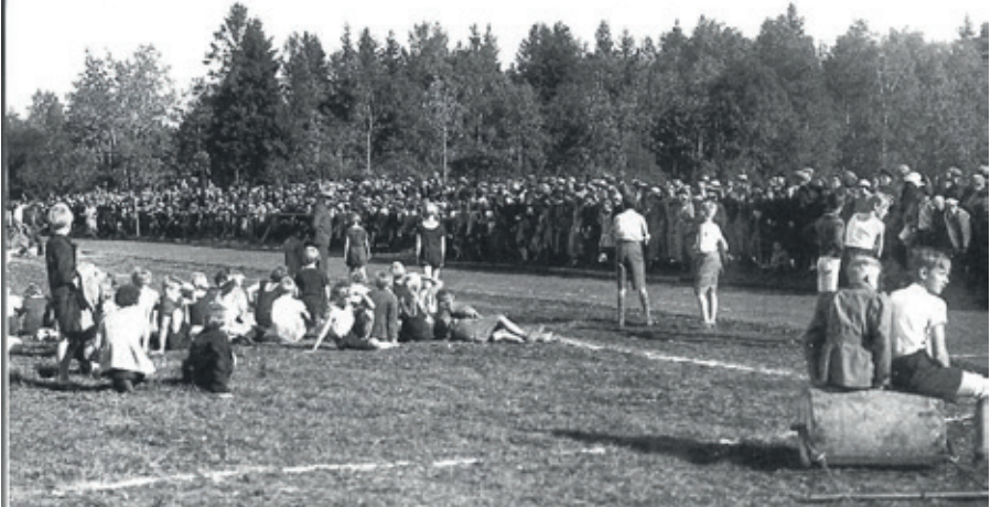
Ungdomstävlingar på 1930-talet

Torsdagen den 14 maj firar föreningen sitt 100-årsjubileum i Stuvstahallen. Öppet för allmänheten mellan 09:30-17:00. Hembygdsföreningen är på plats och visar ett par utställningsskärmar under dagen.