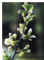
Karin Boyesällskapet