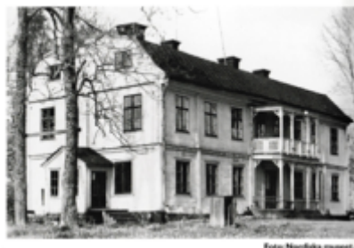
Lisma säteri - eldades upp 1969