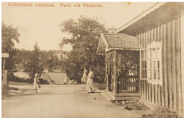
Parti vid Brostugan 1912 (Färjbron).