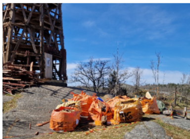
Den nedmonterade panelen och golvet packade i säckar inför borttransportering.

På facebook kan du se hur Björn Bergman följer arbetet med restaureringen av kvarnen.