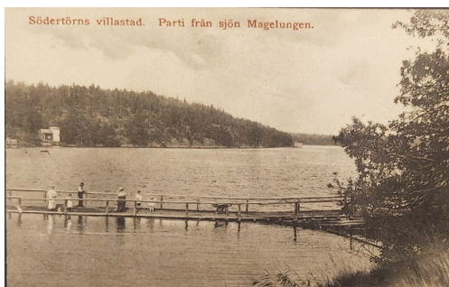
Flottbron, 1820 till 1923.

Överfarten med färja ansågs inte tillräcklig utan man behövde förbättra möjligheterna att ta sig över sjön. Carl Mörner, ägaren till Ågesta, hade förbundit sig att svara för kommunikationen över Magelungen, antingen med en bro eller med en färja. 1820 lät han bygga en flottbro. Inkomsten för färjtransporten uteblev i och med brobygget men ersattes av en broavgift. Färjkarlen fick troligen därmed en ny arbetsuppgift att se till att broavgiften betalades vid passage. I samband med att bron var klar byttes namnet på torpet till Brostugan.