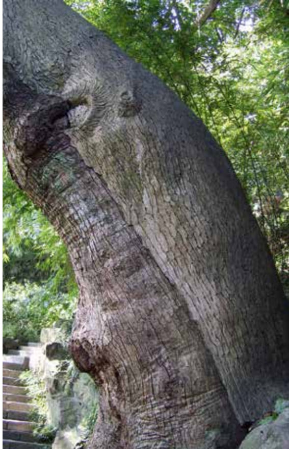
Camphora wird durch Wasserdampfdestillation aus dem zerkleinerten Holz des Kampferbaumes ( Cinnamomum camphora L.) gewonnen.

starr blickende Augen und Pupillenerweiterung). Der Kollaps kann mit heftigen Krämpfen einhergehen. Die ganze Körperoberfläche ist eiskalt. Peripher kleiner, schwacher Puls. Trotz der Kälte des Körpers möchte der Patient nicht zugedeckt werden. Muss aufgrund seiner kurzen und vorübergehenden Wirkung häufig wiederholt werden.