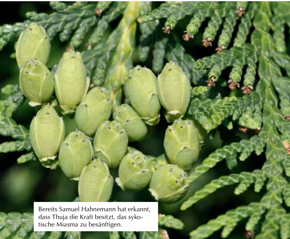
Bereits Samuel Hahnemann hat erkannt, dass Thuja die Kraft besitzt, das sykotische Miasma zu besänftigen.

Wirkt der alte (unter Calc-ars. verbesserte Zustand) immer noch, jetzt nur wieder freigelegt unter Thuja ? Ich entschloss mich, abzuwarten.