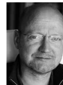
Christoph Schlüter Praxis für Klassische Homöopathie 88250 Weingarten Tel: 0751/5681323

Über seine Familie, die er mir zur Behandlung schickte, erfuhr ich, dass es ihm weiterhin sehr gut gehe. Ein halbes Jahr später erhielt ich eine Weihnachtskarte von ihm, in der er sich für die „kompetente Hilfe“ bedankte und die Verbesserung, die er dadurch in seiner Lebensqualität erhalten habe: „... mein Zustand hat sich geändert wie der sprichwörtliche Wechsel von Nacht zu Tag.“