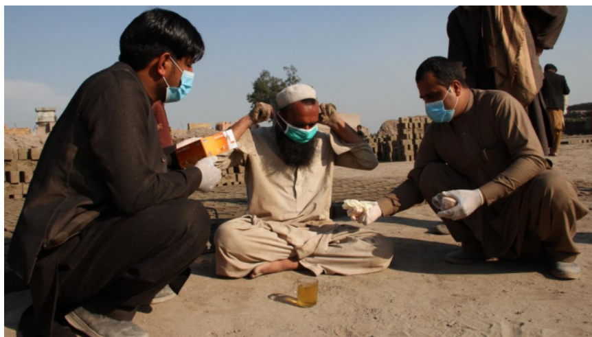
En organisation uddeler værnemidler til beboere i Jalalabad, Afghanistan.

Søndag sprang antallet af bekræftede smittede i Afghanistan fra 24 til 42. Det stadig lave antal hænger sammen med, at der kun er ét laboratorium med testudstyr i hele landet, og at man først nu er begyndt at teste i Herat-provinsen, hvor afghanere strømmer hjem fra Iran. Samtidigt skærer USA voldsomt i bevillingerne til Afghanistan, fordi toppolitikerne ikke makker ret.