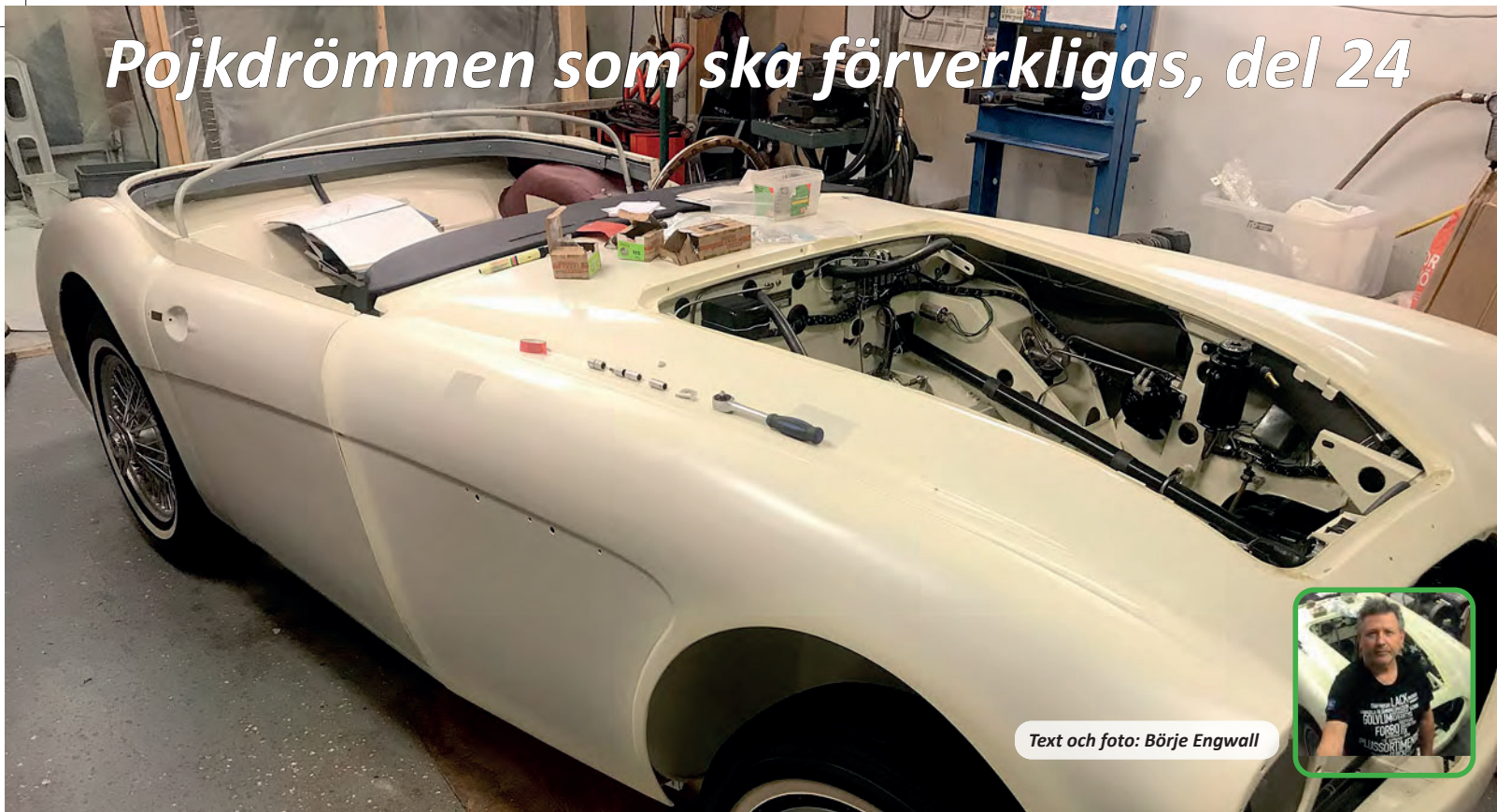
Text och foto: Börje Engwall

N är man knackat plåt, grundat och spacklat under flertalet veckor, kommer jag ofta på mig själv med att vilja pilla på något mer "mekaniskt". Plåtjobb känns ibland som en "never ending story" om man lägger ribban på hyfsad nivå.