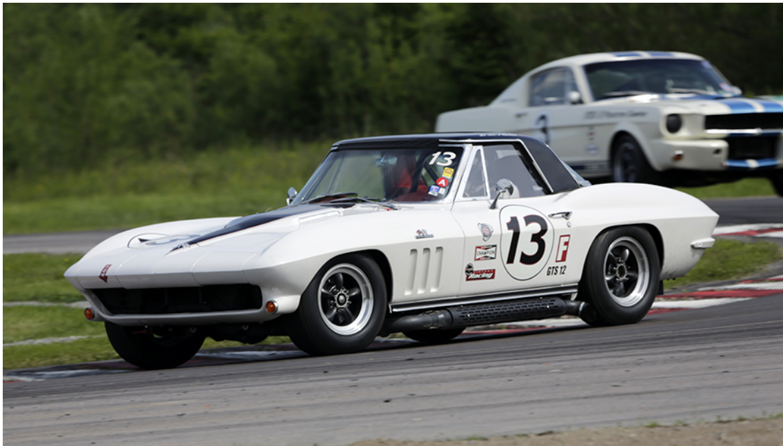
V8-or i en egen kamp.