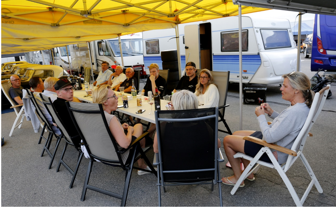
Som vanligt trevlig samvaro i Healey Racing Team med några dito gäster.